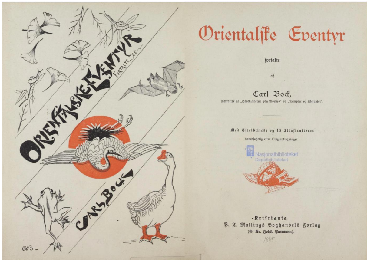
Figur 2. Titelside (Bock, 1885)

Selvom Bock ikke ytrer sig orientalistisk, er selve det at lede efter eventyr i Asien og udgive dem under én kam som orientalske at skrive sig ind i en lang vestlig tradition for, ligesom orientalisterne, at 'opdage' og samle folkeeventyr i Østen.