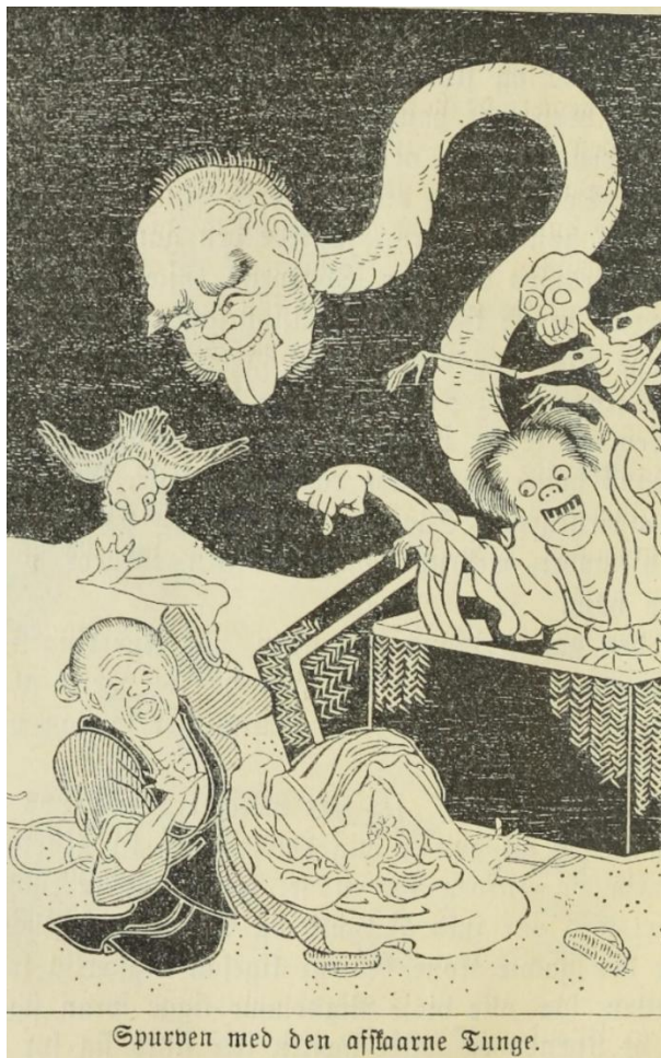
Figur 3. Illustration til »Spurven med den afskaarne Tunge« (Bassøe, 1896)

Modsat den uhjælpsomme kvinde blev manden ikke blot rig, men også lykkelig, »tog en Pleiesøn til sig, og hans Familie blev rig og mægtig. Hvilken lykkelig gammel Mand!« (Bassøe, 1896, s. 119), afslutter Bassøe denne historie.