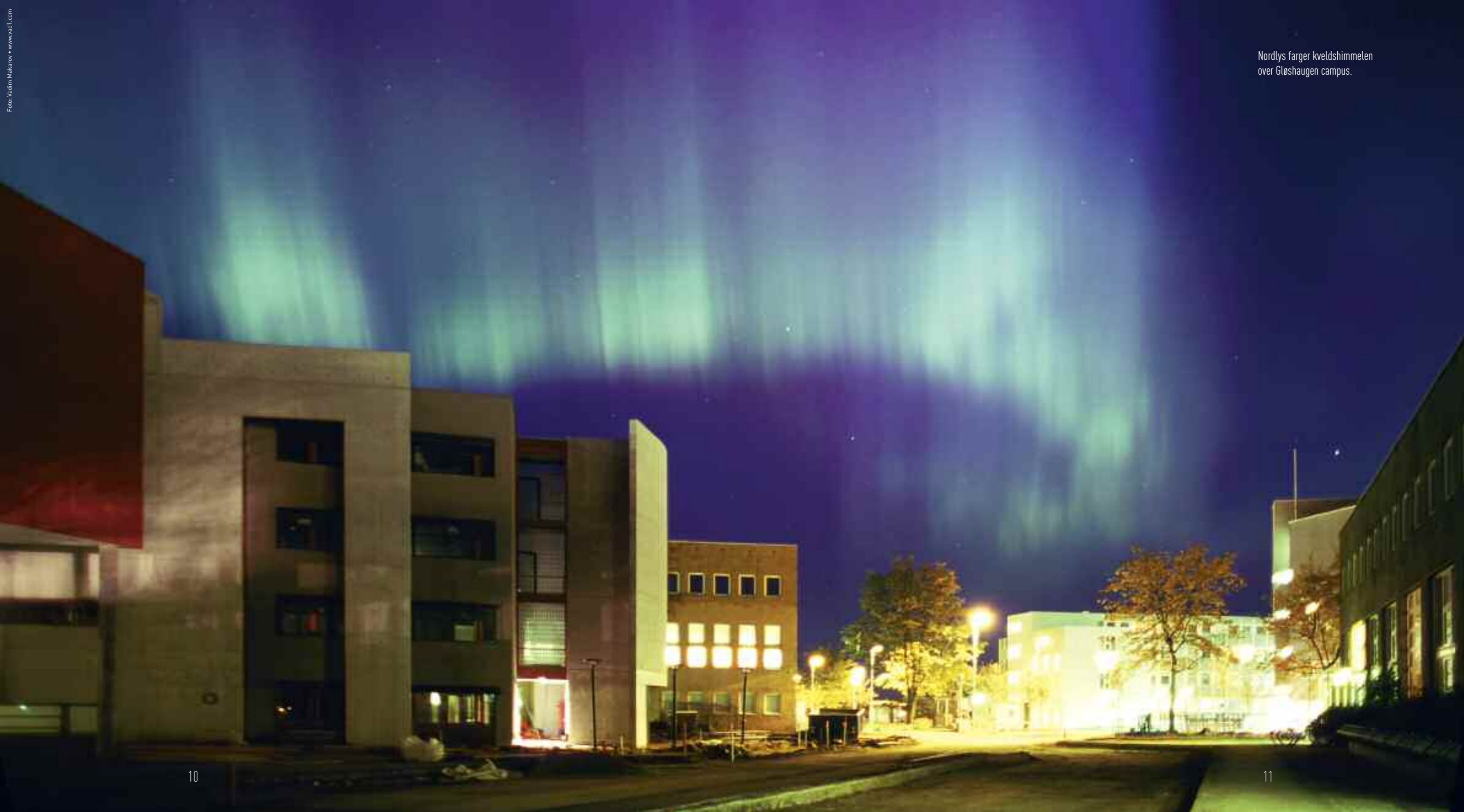
Nordlys farger kveldshimmelen over Gløshaugen campus.