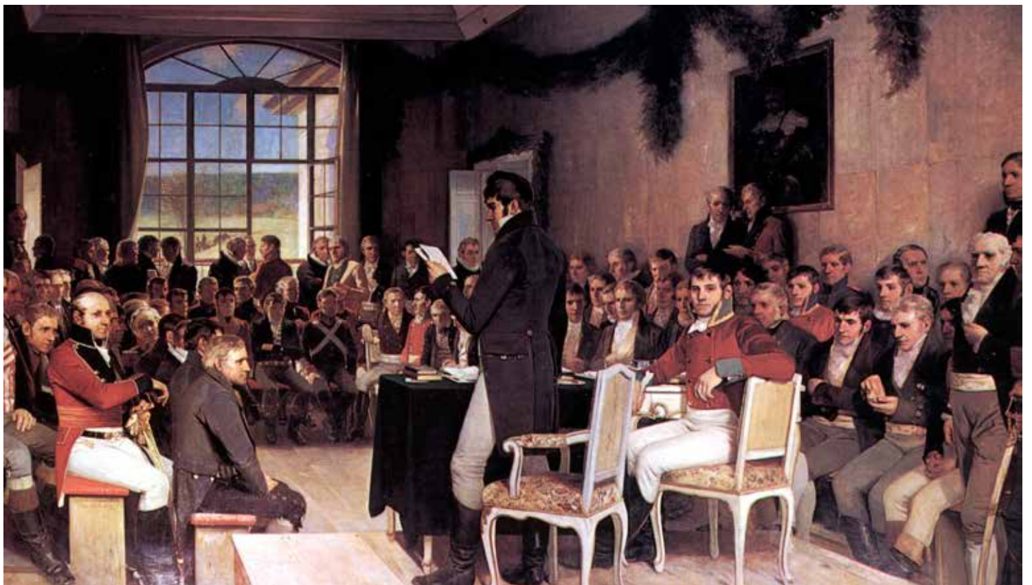
Mange steder falt valget på de tradisjonelle autoritetene, som i bygdene ofte var sogneprestene. Men ikke i Vest-Agder, skriver artikkelforfatteren. Bildet viser maleriet som henger i stortingsalen: «Riksforsamlingen på Eidsvold 1814», malt av Oscar Wergeland.

Av de åtte representantene fra Vest-Agder, var det én prest, Nicolai Wergeland fra Kristiansand. Utenfor stiftsbyen ble ingen prester valgt. Blant representantene fra det som da het Lister og Mandals amt var fire bønder, en kjøp-