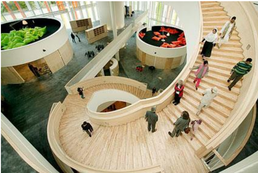
Ørestadens gymnasium, 3xN arkitekter

Konsentrert vil nødvendigvis måtte gå i høyden. Dette gir de samme interaksjonsutfordringene vi sliter med i sentralbyggene. Dette kan motvirkes med større «hulrom» i den vertikale bygningsmassen som kan danne et «vertikalt fellesskapsrom» som for eksempel i Ørestadens gymnas (3xN).