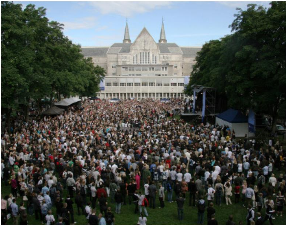
Immatraktering ved NTNU: student-tetthet, potensial for urbanisering av campus og interaksjon mellom fakultet.

Tilbakemelding fra Fakultet for arkitektur og billedkunst 31.03.2014