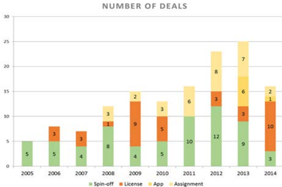
Figur 1. Nyskaping fra fagmiljø ved NTNU. Tall fra 2014 er foreløpige (kilde: TTO)

Det finnes ikke noen samlet oversikt over hva NTNU totalt har produsert, dvs inkludert studentprosjekt, implisitte lisenser i forskningssamarbeid, SFI/SFF/FME-resultater, osv. Tallene i figuren over er derfor bare delvis representative for de faktiske resultatene. NTNU har heller ikke oversikt over resten av Norge, utover en artikkel i Dagens Næringsliv 14 september 2010: