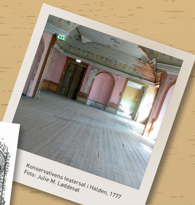
Konservativens teatersal i Halden, 1777