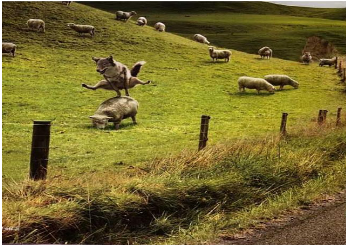
Lister videregående skole