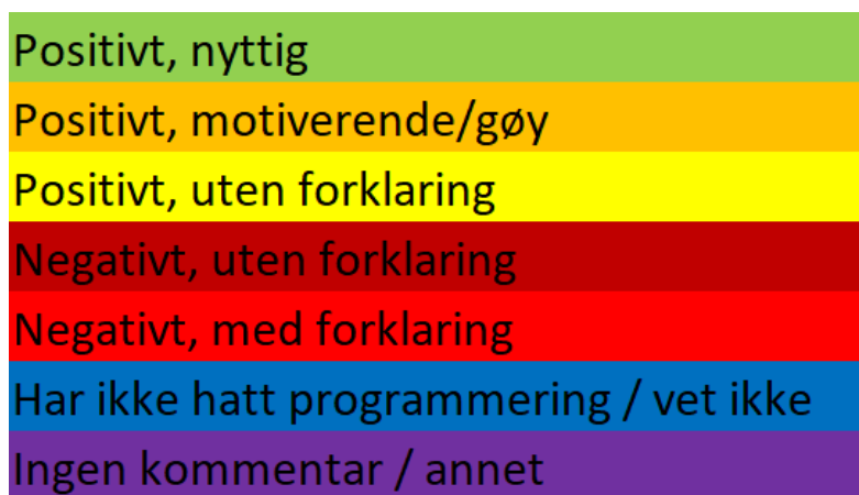
Figur 2: Fargekoder for åpne spørsmål

Det ble laget en spørreundersøkelse med både lukkede spørsmål, der jeg brukte EV-metoden (Eccles & Wigfield, 2002) tilpasset fra spørsmål brukt av Storesund (2022) og åpne spørsmål, tilpasset fra spørsmål brukt i en annen undersøkelse om holdninger til programmering (Bott et al., 2019). Spørreundersøkelsen ble gitt i pausen i en forelesning i mekanisk fysikk, tidlig i 1. semester. Spørreundersøkelsen fikk 135 respondenter, de fleste fra bachelor i fysikk (BFY), master i fysikk og matematikk (MTFYMA), eller lektor i realfag (MLREAL). Like over en tredjedel av respondentene (37%) hadde fullført vgs. forrige skoleår, og dermed ville ha fulgt ny læreplan. De lukkede spørsmålene brukte en 5-steps Likertskala, fra «svært uenig» til «svært enig», med og mulighet for å svare «ikke relevant». På de åpne spørsmålene ble respondentene bedt om å svare utfyllende. De åpne spørsmålene ble kodet inn i forskjellige kategorier, slik at de kunne behandles kvantitativt (se figur 2 og 3). Enda hovedfokuset på spørreundersøkelsen var kvantitativ analyse, ble svar på enkelte spørsmål analysert kvalitativt.