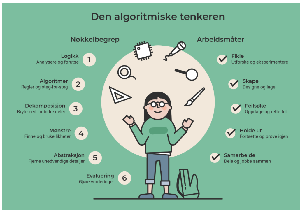
Figur 1: Utdanningsdirektoratets 'Den algoritmiske tenkeren' (Udir, 2019c)