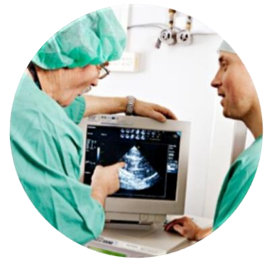
MEDICINE AND HEALTH