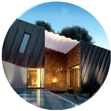
ARCHITECTURE AND ART