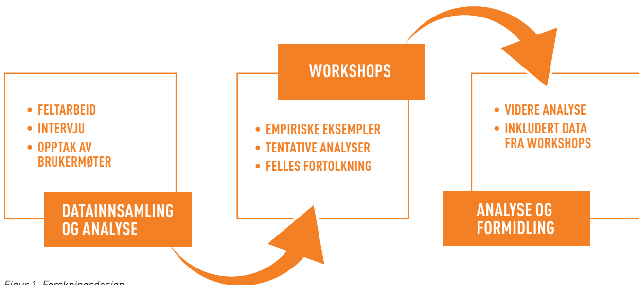
Figur 1. Forskningsdesign

UTVEI-prosjektet ble designet i tre steg. Første steg innebar datainnsamling og detaljerte analyser av interaksjonen ved hjelp av analytiske verktøy fra vårt fag. Andre steg vektla kunnskapsutvikling i samarbeid med veilederne og et felles fortolkningsarbeid med utgangspunkt i konkrete utdrag fra datamaterialet og forskernes tentative analyser. Tredje steg innebar videre analyser av data, inkludert data fra samarbeidet med veilederne, og formidling fra prosjektet.