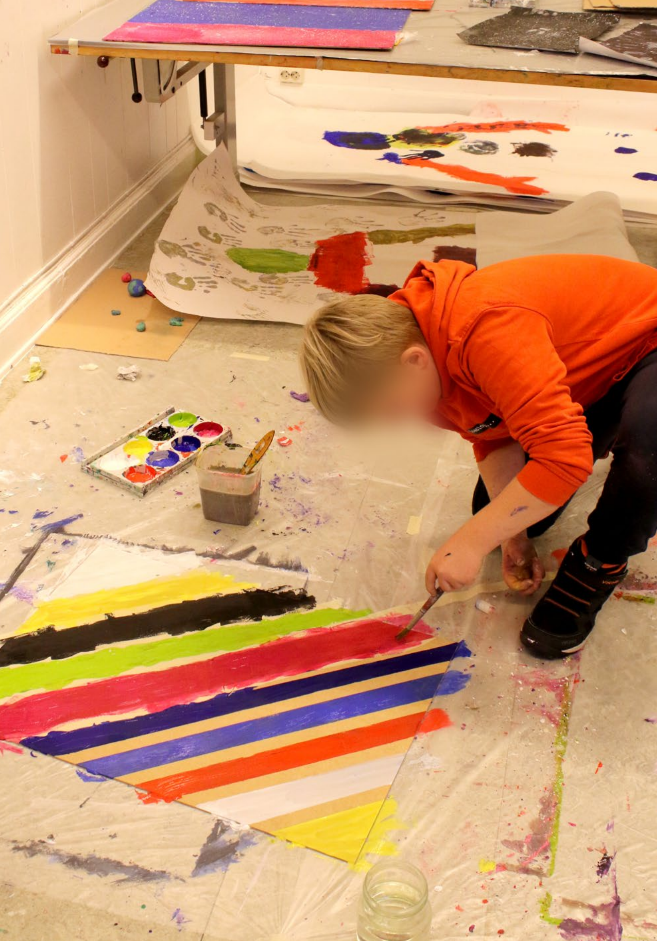
Til venstre: Eksperimentering med maling av striper