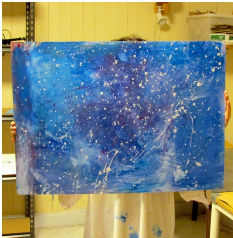
Intervju med barn utvalg 1. 2. dag 1. samling.

«B. og de for eksempel er ikke så gode i norsk for det er ikke så lenge siden de kom til Norge, og da blir det en god del misforståelser. Så det kan være noen andre som har en helt annen krangel også bare... kommer de, og så skal de bare ta parti med bestevennen sin, og da blir det bråk...»