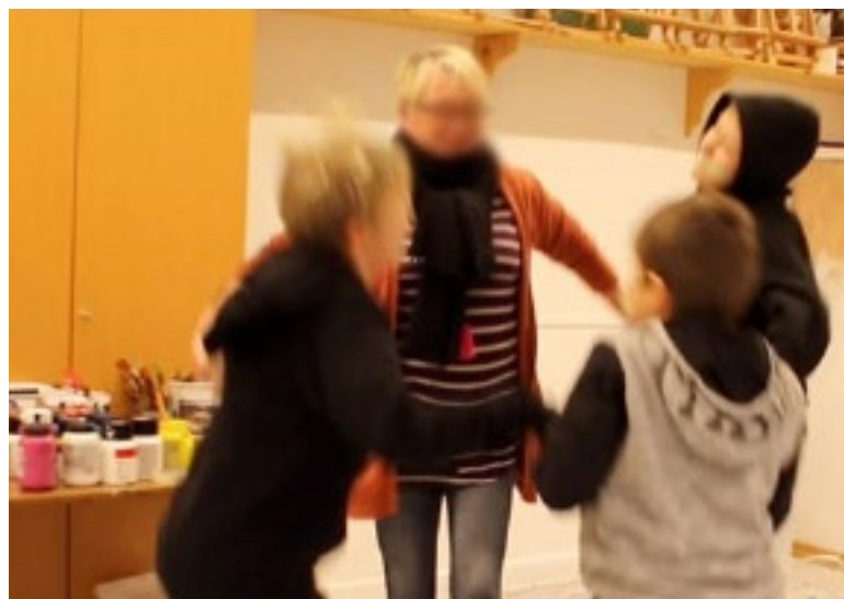
Utdrag fra feltnotat utvalg 1. 1.dag, 2. samling.