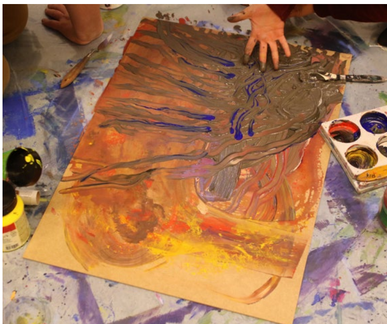
Eksperimentering med bruk av forskjellige teknikker.

Intervju med barn, utvalg 1. 1.dag 2 samling.