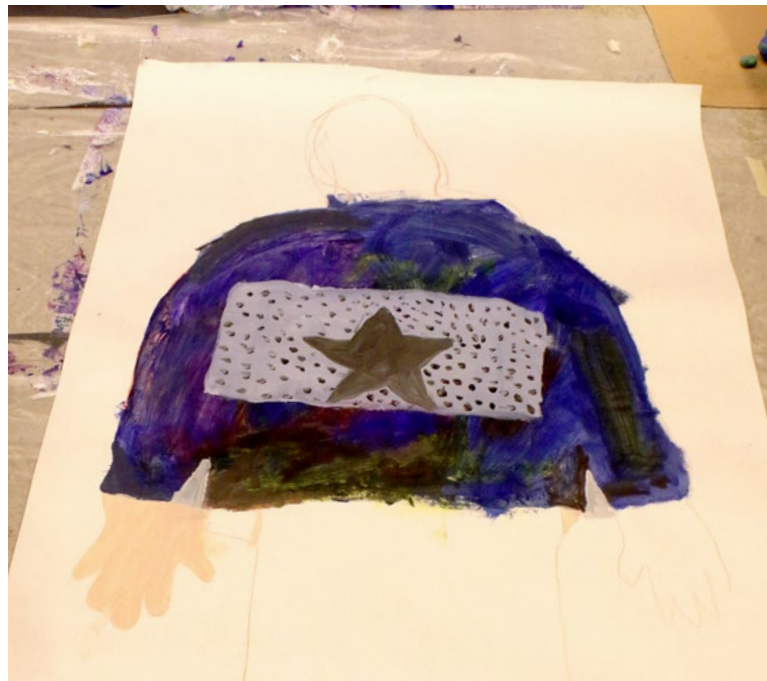
Utdrag fra feltnotat, utvalg 1. siste dag.

Deltakerne er stolte av bildene sine og stolte av at andre skal se dem, og de viser engasjement for å finne fram til hvordan bildene skal settes sammen i utstillingen.