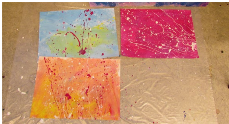
Flere ble inspirert til å bruke dråpeteknikk.

Uten å tenke på det, har gutten avkodet kompleks digital og analog kommunikasjon fra alle i et rom i en periode, samtidig som han spontant har relatert til og vært en del av den samme kommunikasjon. Den helhetlige kommunikasjonsforståelsen er guttens utgangspunkt for fortellingen om sine inntrykk av de andres væremåte i en gitt kontekst.