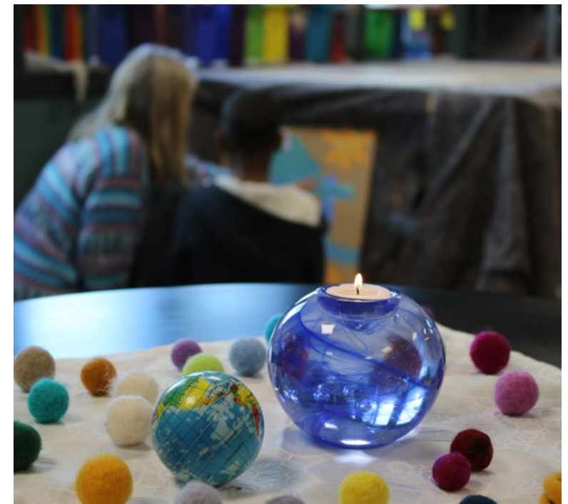
Åpning av malerverksted med jorda, lys og farger

Vi har delt resultatene inn i fire hovedområder. Første del vil omhandle en beskrivelse av Peacepainting sin metodikk og hvordan PP-malerverksted fungerer som et pedagogisk konsept. Vi vil deretter rette søkelys på barns deltakelse og opplevelse av verkstedene. Deres opplevelser er rettet mot erfaringer av sosiale samspill med de andre, og individuelle erfaringer av hvordan de selv opplevde å bruke maling som redskap for å kommunisere.