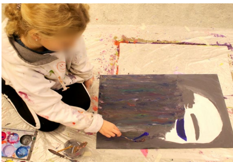
Overmaling, utvikling av idé.

Utdrag fra feltnotat utvalg 1. 1. dag, 2. samling.