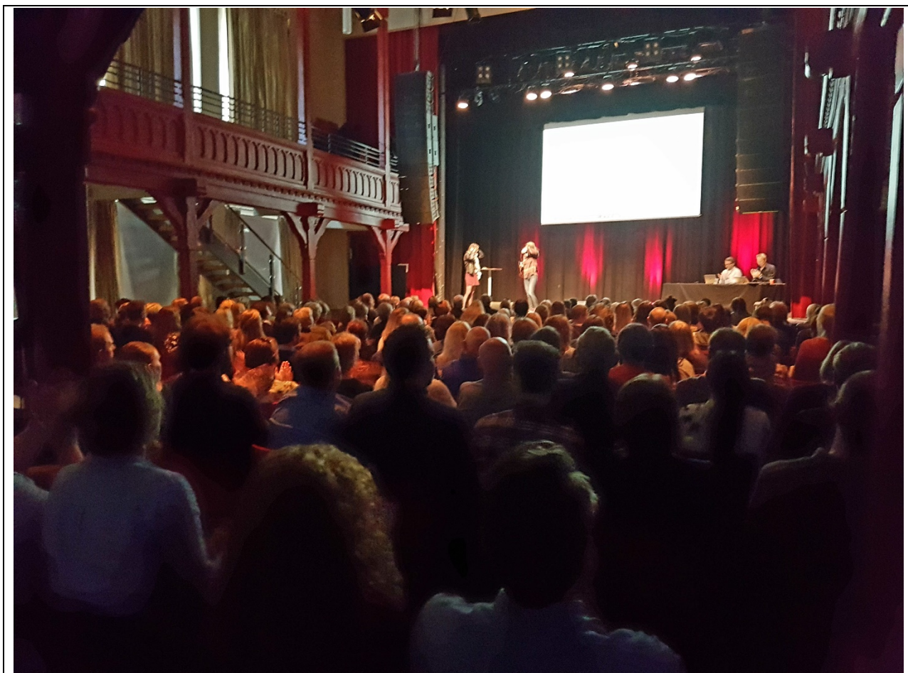
Figur 2. Fra TeachMeet 2017.

Samtlige tiltak er fullfinansiert av partene, med unntak av enkelte FoU-prosjekter, som har ekstern finansiering (offentlig PhD-ordning). Våren 2018 er det utviklet en FoU-strategi i USSiT. Her skilles det mellom tre nivåer for FoU-prosjektene – mikro, meso og makro – som vist i Tabell 1. Hittil er det utviklet prosjekter på mikro og meso-nivå.