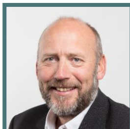
Tor Grande Prorektor for forskning NTNU

Gjennom en rekke lunsjmøter, med ulike tema, ønsker vi å bidra til økt innovasjonskapasitet i havbrukssektoren.