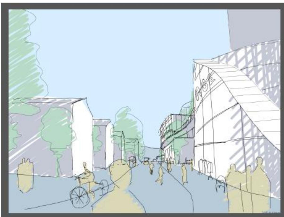
Sem Sælands vei sett fra Høgskoleringen