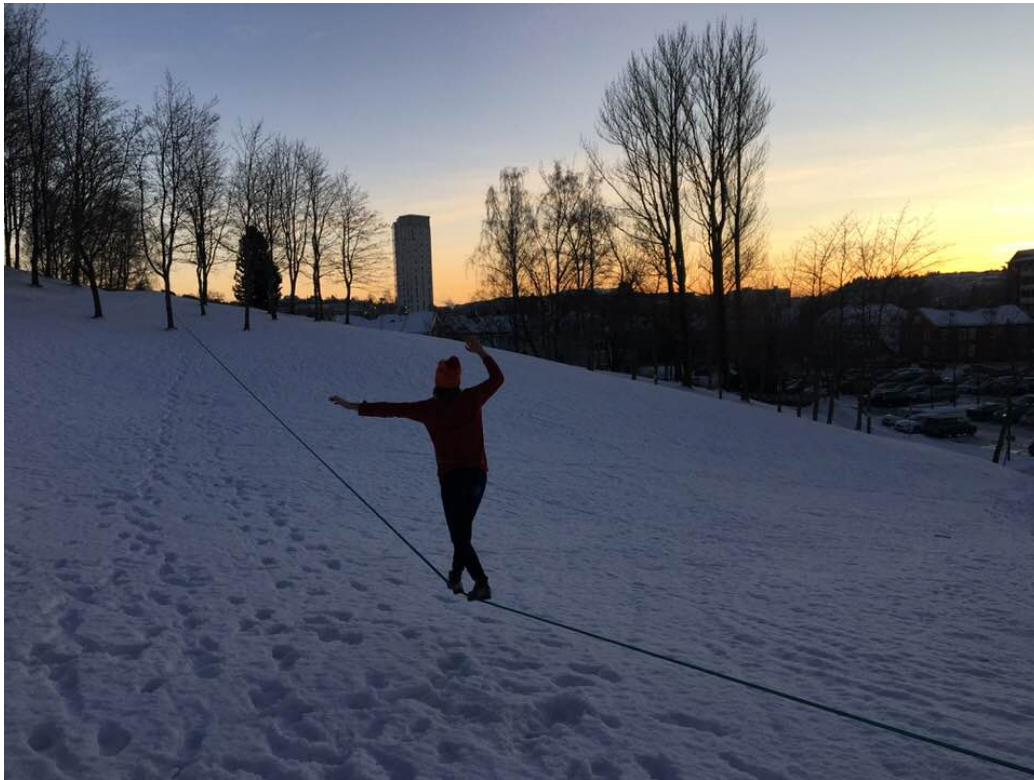
Figur 3: Øyeblikksbilde fra Hestehagelunden januar 2018. Linen følger den nederste traséen vist i Figur 1.