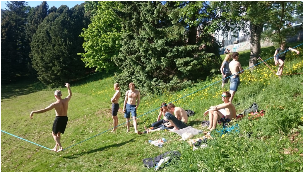
Figur 2: Øyeblikksbilde fra Hestehagelunden mai 2018. Linen i forgrunnen følger den øverste traséen i Figur 1.