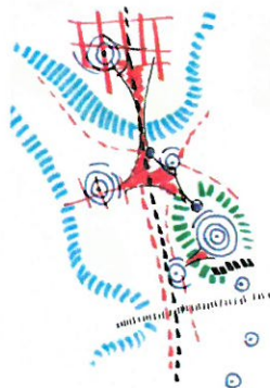
ALTERNATIV NORD - KALVSKINNEN