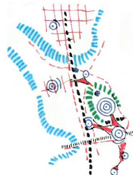
ALTERNATIV SØR - OMRÅDENE SØR FOR GLØSHAUGEN