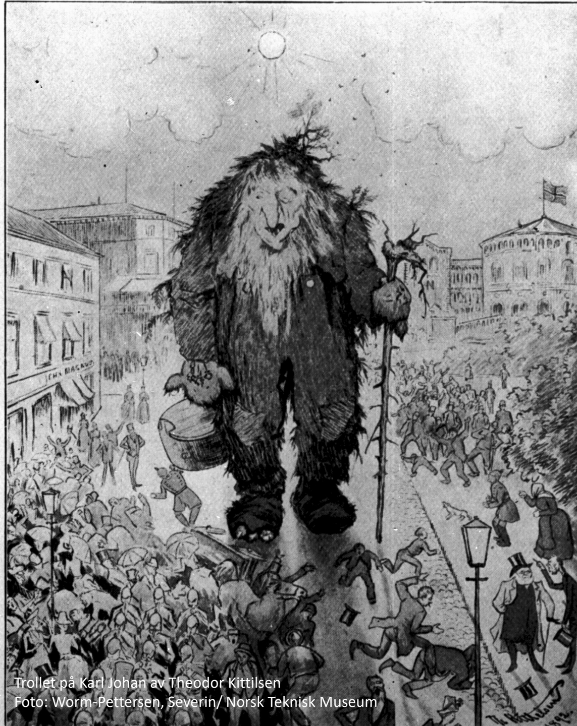
Trollet på Karl Johan av Theodor Kittilsen