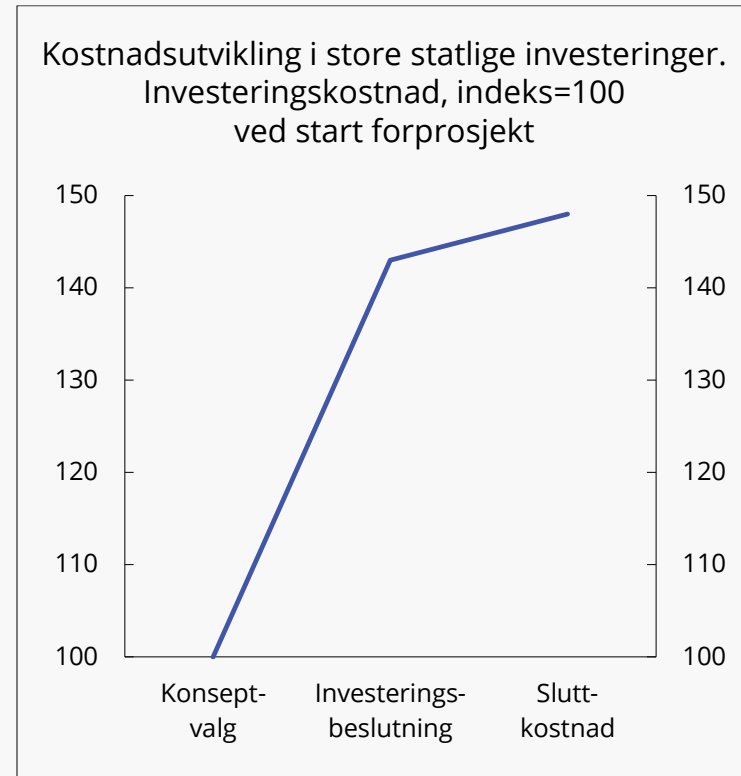
Figur 12.2 Kostnadsutvikling i store statlige investeringer. Investeringskostnad, indeks=100 ved start forprosjekt