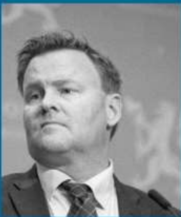
Helsebyråkraten som kan telle