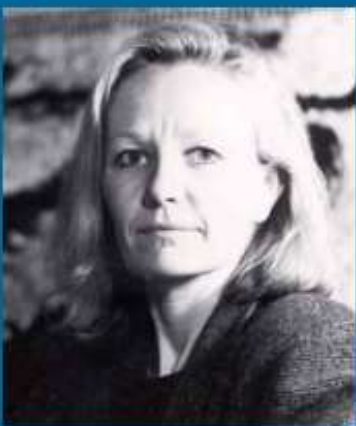
Psykologen som ser følgene

Vi som arbeider på et universitet ser hvordan studentene får problemer når de blir fratatt fellesskapet, blir sittende alene på hver sin hybel måned etter måned, og må forholde seg til digitale foredrag på PC-skjermen istedenfor forelesninger sammen med andre. Og hvor nedbrytende det er på motet og innsatsen,