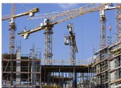
Bygge - og anleggsmarkedene