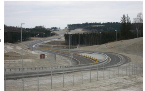
Momarken-Sekkelsten, en veiparsell i Østfold