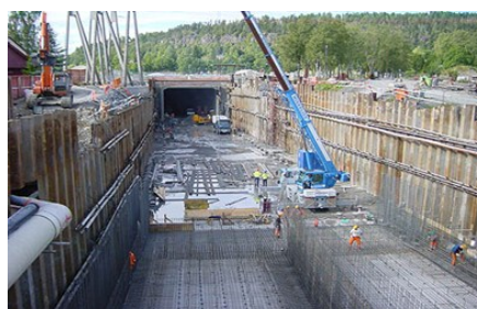
Byggingen av nytt dobbeltspor Sandvika-Asker