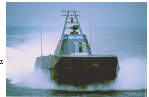
Sjøforsvarets nye MTB-er