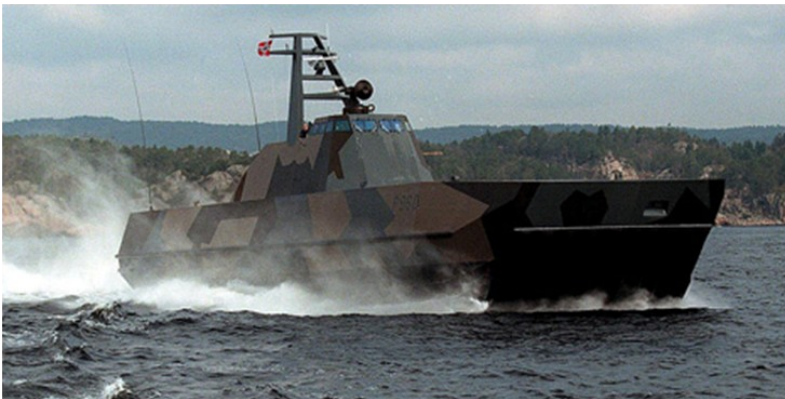
Missiltorpedobåtene (Skjoldklassen) er et kontroversielt prosjekt der sterke koalisjoner har bidratt til utfallet

Rapporten er lagt ut og kan lastes ned fra Concept-programmets hjemmeside www.concept.ntnu.no/publikasjoner/rapportserie .