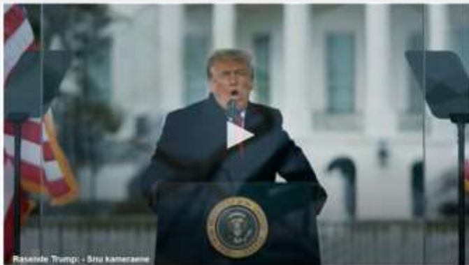
RASER: Det ser ut til å gå mot valgpeter for demokratene i senator-valget i Georgia. Donald Trump beskylder mediene for «falske news».