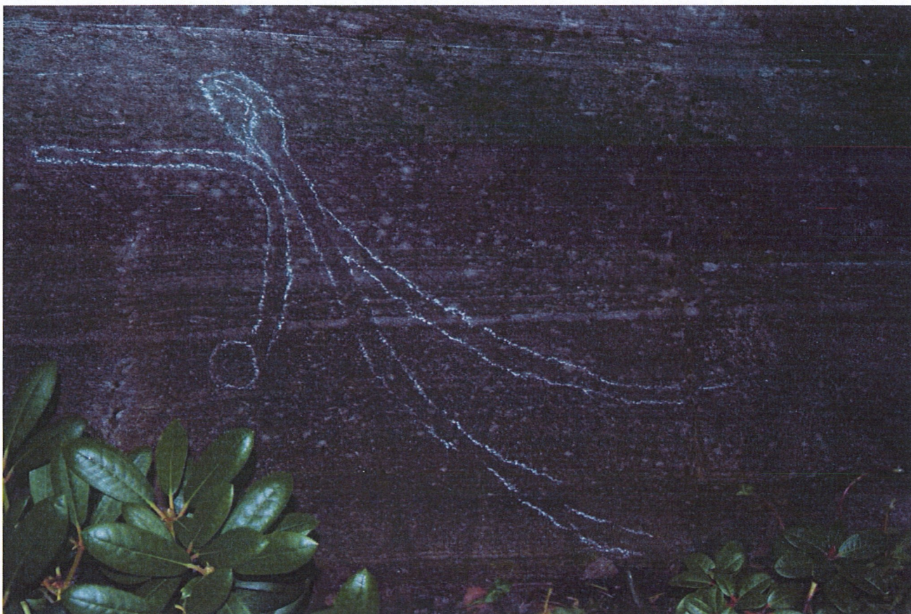
Sørligste felt med fuglefigur