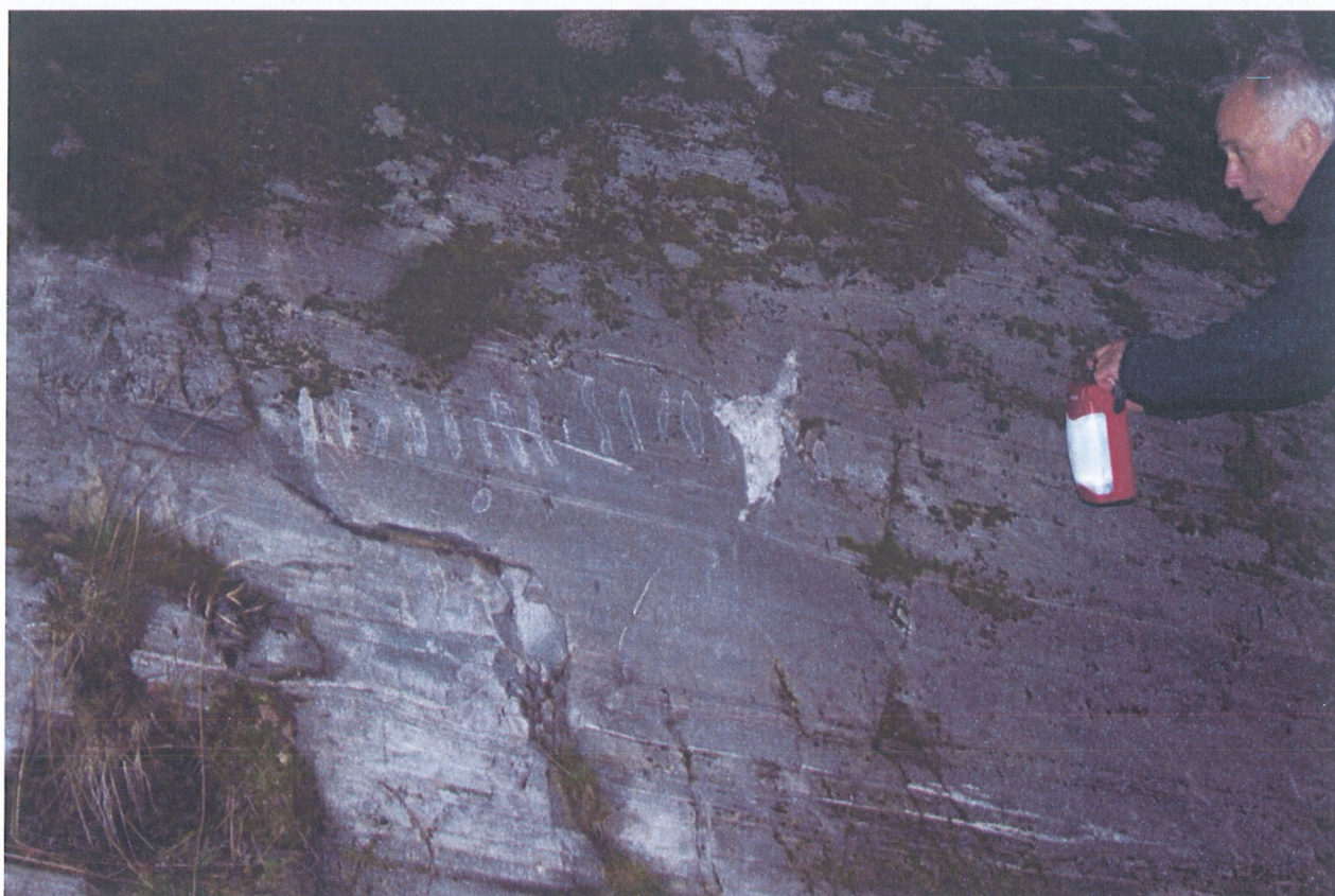
Nordligste felt, oversikt