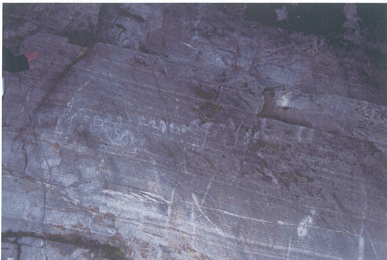
Midtre felt med linjer/geometriske figurer