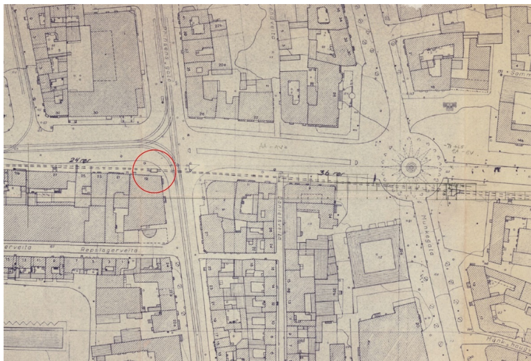
Figur 1: Plassering av koblingsboks (firkant) hvor felt KD ble utgravd – merket med rød sirkel.

Felt KD lå i krysset mellom Kongens gate og Prinsens gate, hvor en planlagt koblingsboks skulle installeres.