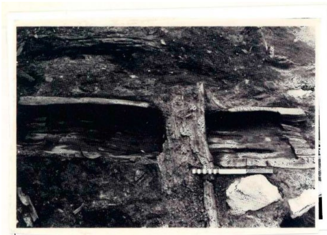
Figur 4: Under passasje K9-5 i fase 9 ble det funnet en dreneringsgrøft (Hentet fra Flodin et.al. 1987:305).