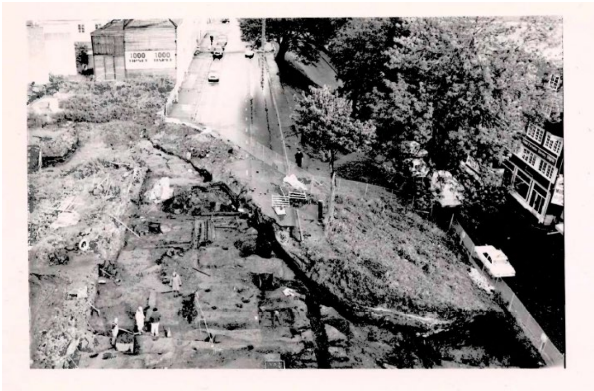
Figur 3: Oversiktsbilde over feltene FZ, FY-v og FY-ø. FZ ligger omtrent midt i bildet. Bildet er tatt mot nord.