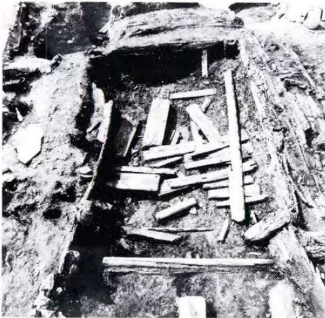
Figur 2: FP fase 6. Latrine K86. Bildet er tatt mot vest. Hentet fra Chilton 1987: 109.