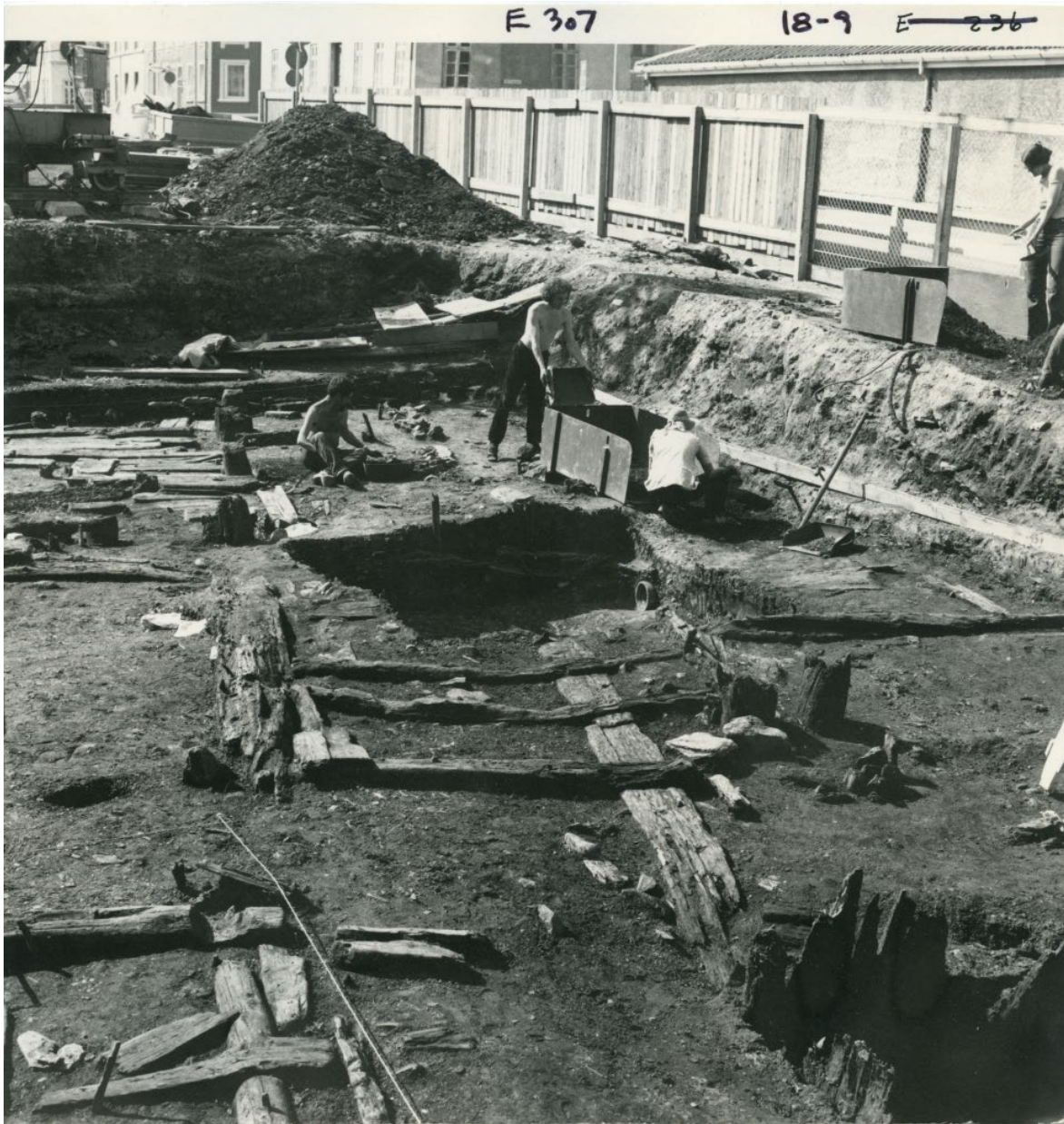
Figur 2: Situasjonsbilde, brannlag E309 (konstruksjon K29) fra deltelt E.