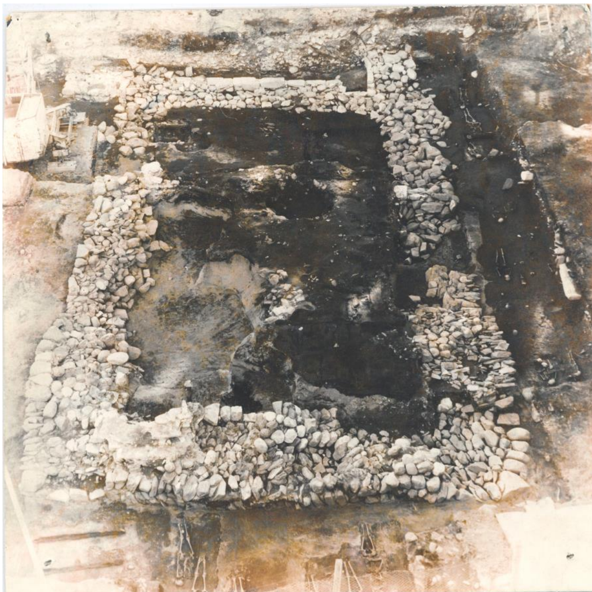
Figur 2: Gregoriuskirkens ruin på felt A, med synlig trappenedgang mot krypten i øvre del av bildet.