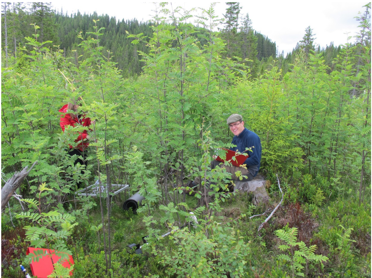
Fig. 1. Eksempel på nyetablert uthegning (Bratsberg, Sør-Trøndelag) våren 2009 (øverst) og tilstanden innenfor den samme uthegningen sommeren 2014 (nederst).