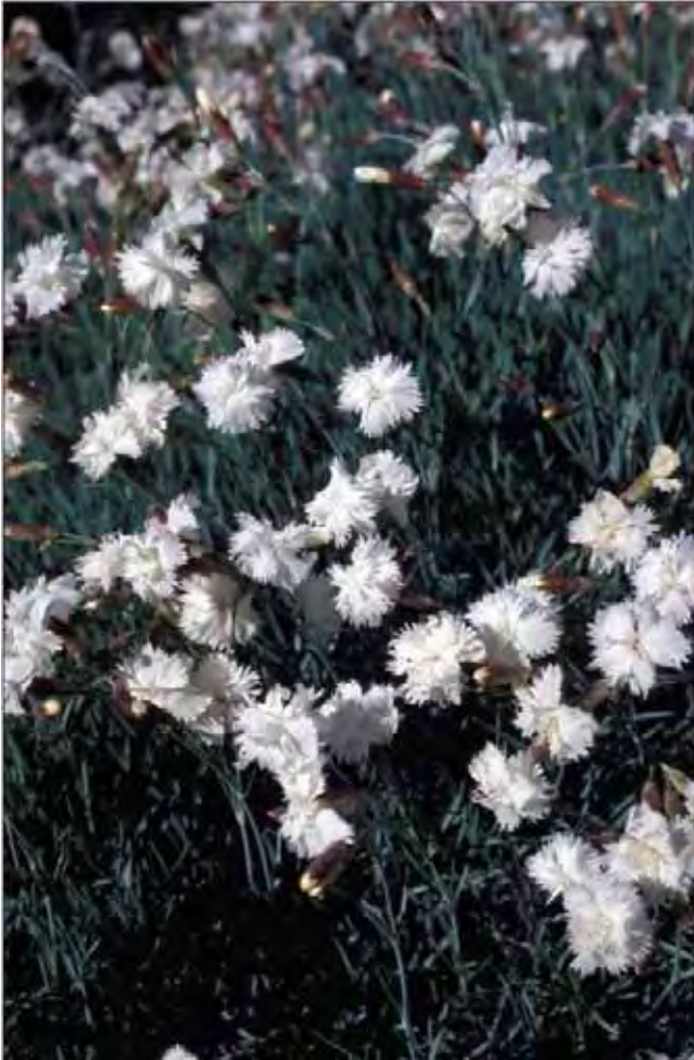
Tette matter eller tuer med fjærellik gjør seg godt som kanter rundt større bed.