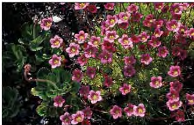
En hagesildre med rosa blomster, med rosetter av skyggesildre til venstre i bildet.

Sildre-artene ser ut til å ha kommet i bruk under 1800-tallet. Tilhører sildrefamilien Saxifragaceae .