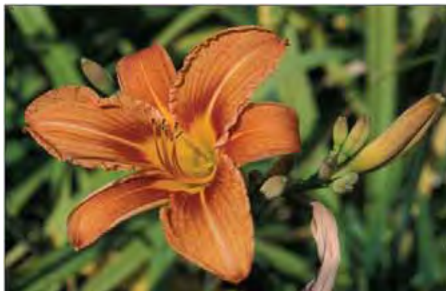
Brun daglilje.

Brunoransje blomster med bølgete kanter på blomsterbladene. Har bredere blad enn gul daglilje og blomstrer senere. Ser ut til å bli mest dyrket i lavlandsområdene i kyst- og fjordstrøk og er mye sjeldnere enn gul daglilje. Setter ikke frø hos oss da ingen norske insekter kan bestøve den. Fra Kina.