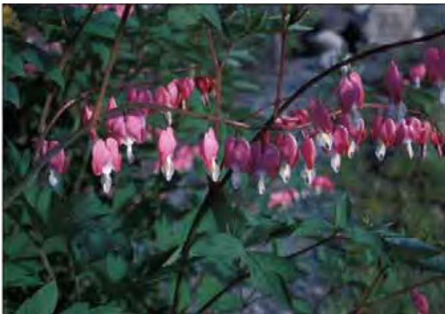
Løynantshjerte ligner ikke noen annen hageplante. Den kan bli ganske omfangsrik.