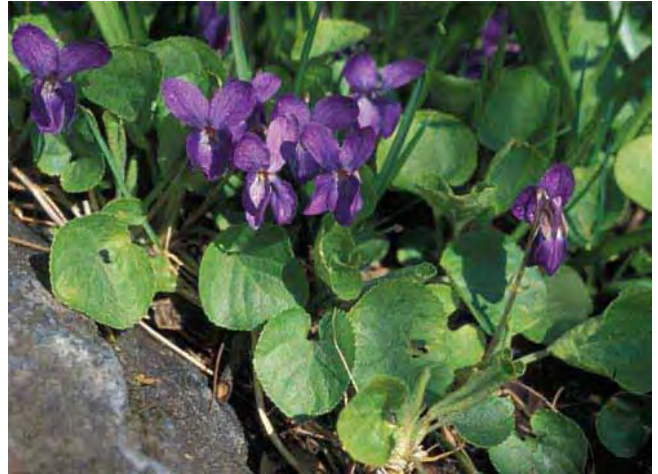
Marsfiol var trolig vanligere tidligere og er blitt en sjeldenhet.