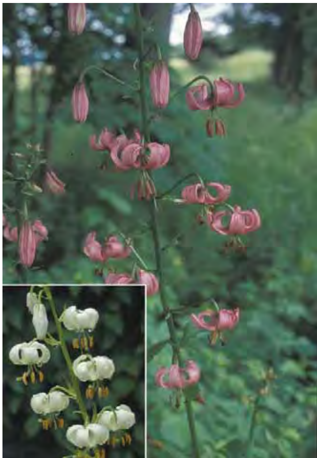
Krøll-lilje kan ha blomster i flere nyanser av rosa og hvitt, dessuten fylte blomster.

Opptil 1,5 m høye stengler med avlange, relativt brede, kranstilte blad i flere "etasjer". I toppen en grenet blomsterstand med rød fiolette, hengende blomster med oppoverbøyde (krøllete) blomsterblad med mørke flekker og gule støvbærere på lange støvtråder. Blomsterfargen varierer fra litt grålig, lys rosa til ganske mørkt rød fiolett; hvite former finnes også. En rosa, fylt form er sjelden, men registrert 4-5 steder i Trøndelag. Dyrket siden middelalderen. Fra Mellom- og Sør-Europa og Asia.