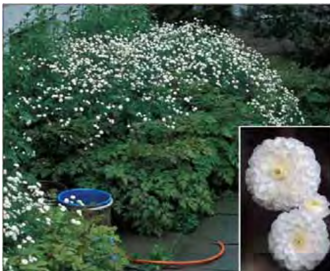
I juni står duppesoleie i full flor.

Mørkegrønne, blanke, hånddelte blad og høy, grenet blomsterstand med små, hvite, fylte blomster. Danner store, hvelvede "tuer". En staude man "får" av noen, siden den ikke setter frø. Ikke uvanlig i Midt-Norge. Når plantenes historie kommer for dagen, viser det seg at mange kommer nordfra; den er vanligere lenger nord og sjeldnere sør i landet. Dette kan ha med blomstringen å gjøre; den har et forholdsvis kortvarig flor, men det varer lenger jo lenger nord den vokser. Visner raskt helt ned etter blomstring, og bør plantes slik at den blir kamuflert utover sommeren. Fra Mellom- og Sør-Europa. Tilhører soleiefamilien Ranunculaceae . Kalles også hvite dupper og sølvknapp.