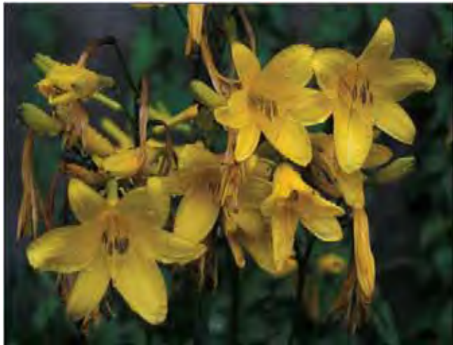
Gul daglilje.

Rent gule, duftende blomster, noe smekreere enn hos brun daglilje. Bladene er smalere enn hos brun daglilje. Er mer hardfør enn denne og dyrkes i de fleste deler av Midt-Norge. Setter rikelig med frø. Fra ØstAsia. Tidligere kalt H. flava .