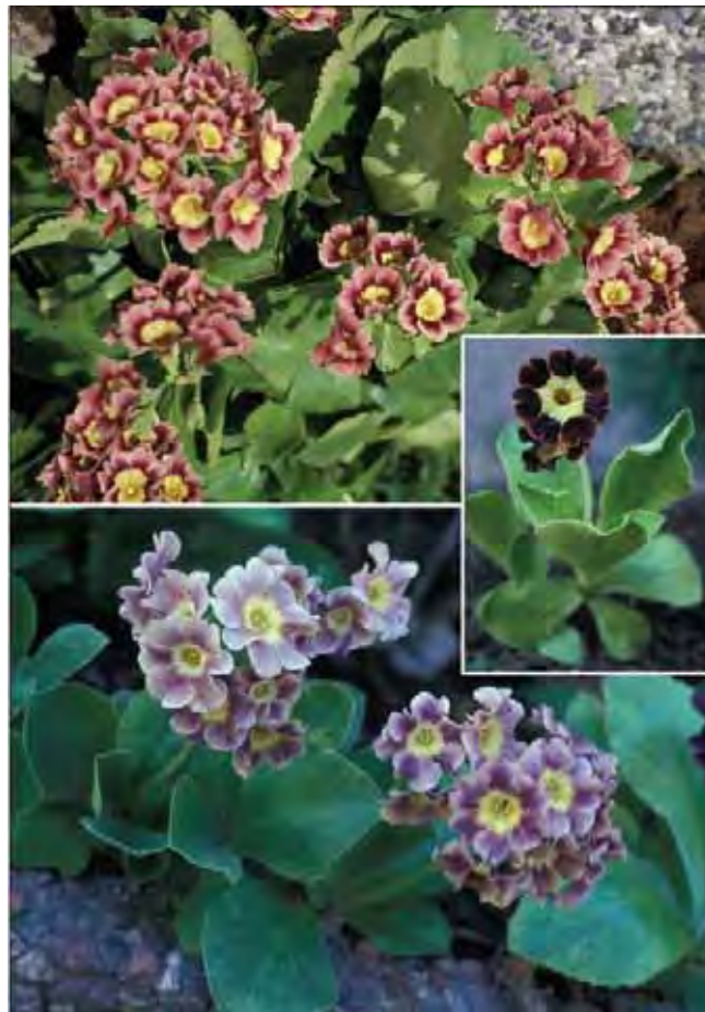
Hageaurikkel varierer mye i blomsterfarge.

Dette er hybriden mellom Primula auricula med gule blomster og P. hirsuta som har røde blomster med hvitt øye. Begge hører hjemme i Alpene, og hageprimula har vært dyrket siden 1570. Bladene i rosetten er lyse og tykke og ofte melet. Det har vært drevet et omfattende foredlingsarbeid (som stadig pågår), og variasjonen i blomstens form og farge er meget stor. Auriklene er hardføre og dufter godt. Også dette er planter som var vanligere før. De har en tendens til "vokse seg opp" av jorden og må omplantes ofte, ellers vil de lett forsvinne. Tilhører nøkleblomfamilien Primulaceae .