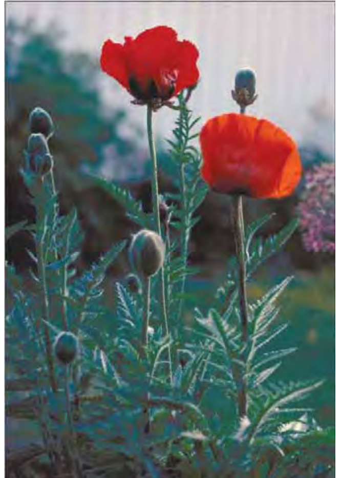
Store, røde blomster og flikete, stivhårete blad er orientvalmuens varemerke.

Ved basis av kronbladene er det en svart flekk. Orientvalmue er ikke lenger så vanlig, kanskje fordi den oransjerøde fargen kan være vanskelig å plassere, og bladverket blir stygt etter blomstringen (men det er bare å klippe det ned). Kapslene har også dekorasjonsverdi; de er store og runde med et stjerneformet, fløyelsaktig arr på toppen. Det stadig økende utvalget av sorter med spennende farger gir kanskje orientvalmue en "ny giv" i hagesammenheng. Opprinnelig fra Vest-Asia. Tilhører valmuefamilien Papaveraceae .