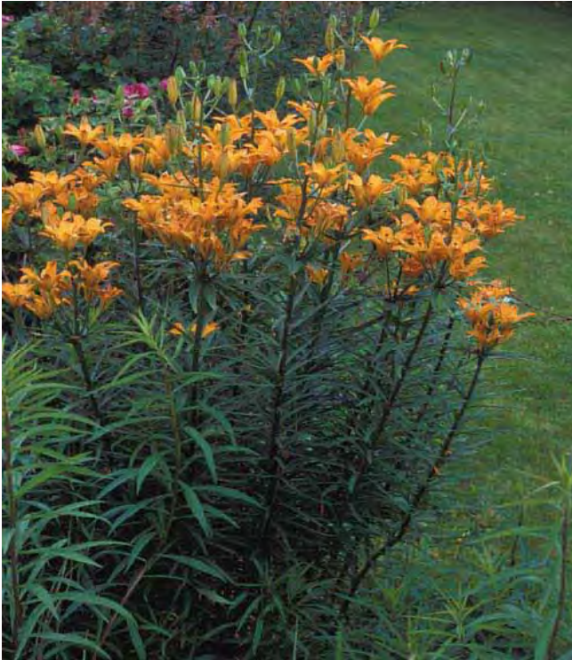
Safranlilje er en staselig plante som ikke er særlig utbredt.