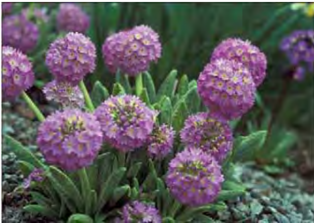
Kuleprimula med blomster i den opprinnelige fargen. Etter blomstringen strekker bladene seg kraftig.

Rosetter av tungeformede, rynkete blad. Rake stengler med blomstene samlet i kulerunde hoder. Opprinnelig farge er mørk rosa eller rødilla, men det finnes mange sorter, så utvalget går fra hvitt til rosa og videre til dypt purpur i blomsterfarge. Bladene strekker seg etter blomstring til opptil 30 cm. Introdusert som hageplante på 1800-tallet, og brukes i fjellhager og rabatter. Fra Kina – Himalaya. Tilhører nøkleblomfamilien Primulaceae .