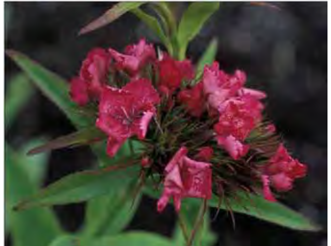
Den tette blomsterstanden i toppen av stengelen er karakteristisk for busknelik.

Fra en rosett med avlange, blanke blad kommer en 20-60 cm, stort sett ugreinnet stengel med en skjerm-lignende kvast i toppen. Fargespekteret går fra rent hvitt til dyp rosa og rødt, med ensfargete eller brokete blomster i juni. Kortlivet staude som setter rikelig med spiredyktige frø i Midt-Norge. Ved såing blomstrer de først andre året og er fine et par år til, men så går de sakte ut. Før det har de fått mange etterkommere i hagen og kanskje i helt andre farger enn de opprinnelige. Dyrket siden 1700-tallet. Fra Sør-Europa. Tilhører nellikfamilien Caryophyllaceae .