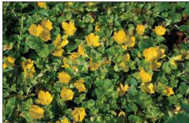
Krypfredløs, et trivelig innslag i plener.