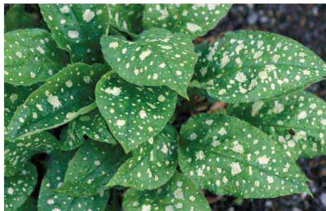
Blad av flekklungeurt. Også noen andre arter lungeurt kan ha flekkete blad.

Bladene smalner relativt brått mot bladskaftet, har sølvfargete flekker og er meget dekorative. Kanskje mest dyrket for bladverkets skyld. Røde, senere blå blomster. Dyrket siden 1900-tallet. Fra Sør-Europa.