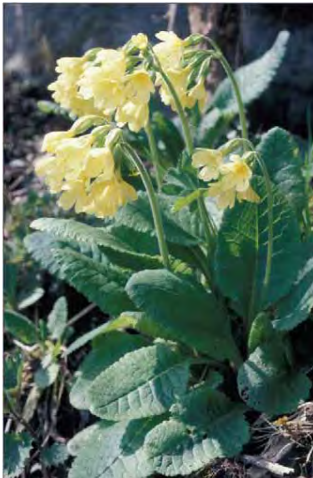
Hagenøkleblom blomstrer tidlig om våren og visner raskt.

Ligner sin viltvoksende slektning marinøkleblom Primula veris , men har litt større og blekere gule blomster i en ensidig, hengende skjerm og relativt jevn overgang fra bladplate til bladskaft. Den er meget hardfør og forvilles lett. Nedlagte småbruk og fraflyttede hus kan formelig stå i en blekgul eng om våren. Er også vanlig i plener og veikanter i Midt-Norge. En eurasiatisk art. Tilhører nøkleblomfamilien Primulaceae .