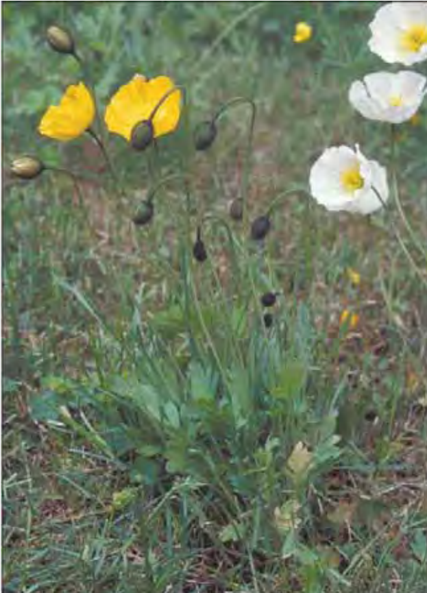
Sibirvalmue sprer seg lett og kan opptre som "ugras" i grusganger og kantsoner i hagen.