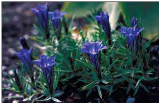
Kinasøte har smale blad og blomster uten frynser i kronen.

Tette, lave tuer eller matter av stengler med smale, litt krumme blad. Oppdaget i Kina tidlig på 1900-tallet og ble en populær hageplante etter første verdenskrig.