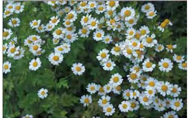
Matrem finnes rikelig i en del hager, men er i dag neppe brukt til annet enn prydd.

Ettårig til kortlevd flerårig, grenet plante med flikete, grovtannede blad og mange ca. 2 cm brede, hvit/gule "blomster" (kurver) i halvskjerm. Gammel nytteplante, dyrket siden middelalderen. Fra Øst-Europa og Vest-Asia. Tilhører kurvplantefamilien Asteraceae .