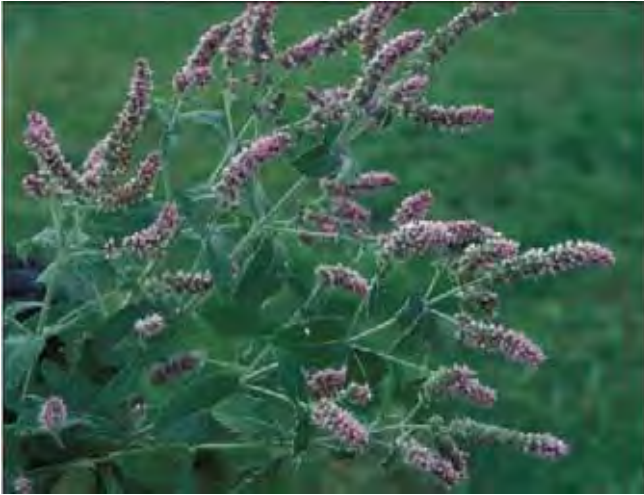
Gråmynte er lodden, men ellers ikke så ulik grønn mynte.