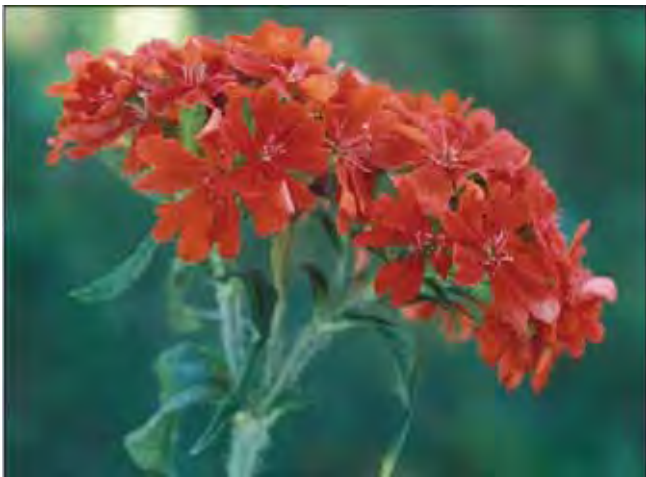
Blomsterfargen til ildkjærlighet er intens.

Stive (men ganske sprø) stengler med motsatte, avlange blad. Planten er stivhåret. Blomster i tett kvast i toppen av stenglene. Med den nesten overveldende skarlagensrøde blomsterfargen kan den være vanskelig å plassere i en hage. Men eksperimentering med fargesammensetninger kan være en utfordring, og den har hatt plass i hagene siden renessansen. Moderne sorter har farger som er mer rosa, men skal det være "brennende kjærlighet", må den være rød! En nøysom plante, som slett ikke er vanlig lenger. Fra Russland. Tilhører nellikfamilien Caryophyllaceae .