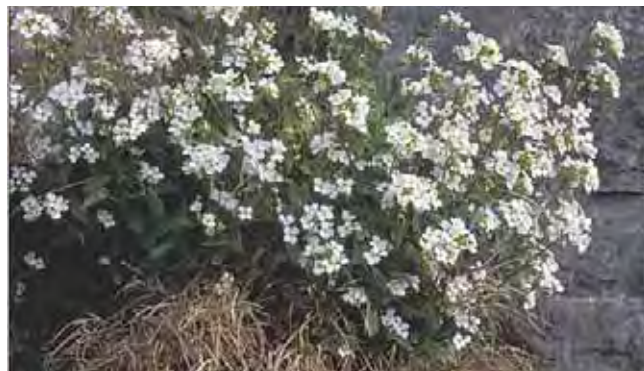
Hageskrinneblom i en bergvegg, med vaser av fjorårets blomsterstander fremdeles hengende på.

Vide matter eller lave puter av stengler med avlange, hårete og grovt tannete blad og 1-2 cm brede, hvite blomster med fire kronblad. Lyst rosa blomster forekommer også. Setter mengder av frø i lange, spriken de skulper og spres lett. En av de villigste og vanligste plantene på skrinne berg og som kantplante på tørre steder. Dyrket siden 1800-tallet og finnes forvillet noen steder i lavlandet. Kommer fra Sør-Europa og Vest-Asia. Tilhører korsblomstfamilien Brassicaceae .