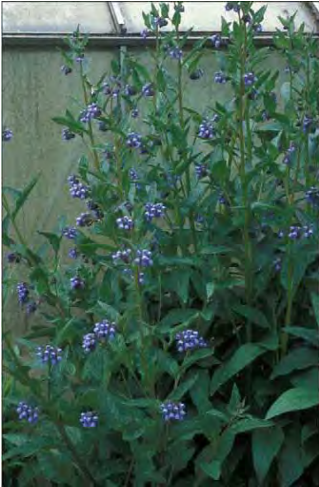
Fôrvalurt er slankere og mer høyvokst enn valurt.