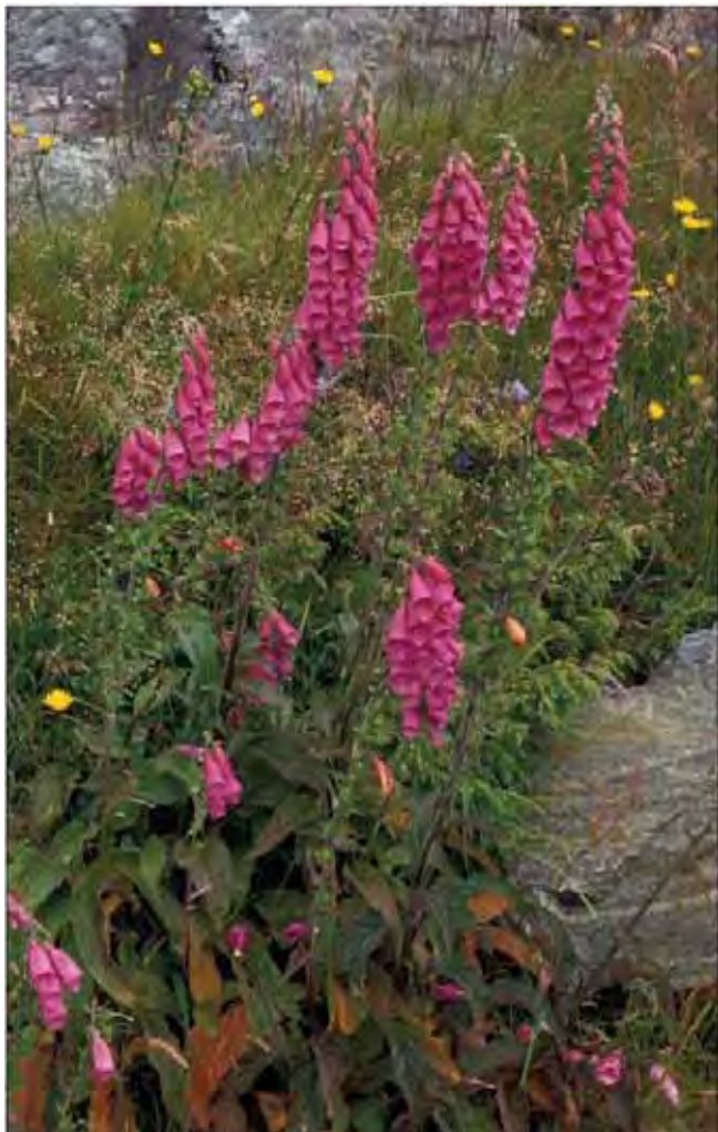
Revebjelle vil ha mye lys og rom rundt seg, både i naturen og i hager.

Trondheimsfjorden vokser revebjelle som vill art, men tas ofte inn i hagene. Det som finnes i hagene kan også være handelsvare. Dyrket siden middelalderen som medisinplante. Tilhører maskeblomstfamilien Scrophulariaceae .