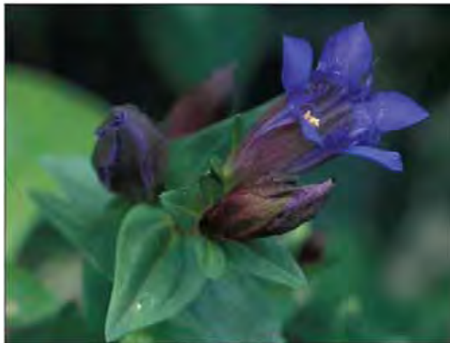
Frynsesøte kjennes lett på både de brede bladene og blomstene med frynser i kronen.

Løse matter av stengler med sittende, brede blad med buede nerver. Blomstene har tydelige frynser mellom flikene i kronen. Dyrket siden andre halvdel av 1800-tallet. Fra Kaukasus.