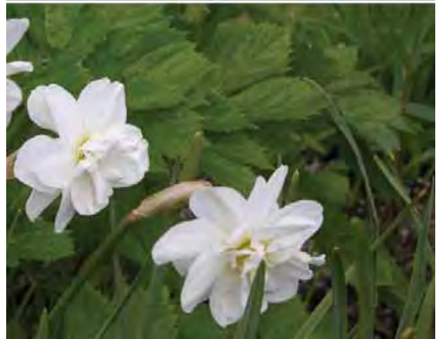
Pinselilje finnes det mange sorter av. Noen har ensfarget, gul bikrone, andre har fylte blomster. Foto Eli Fremstad