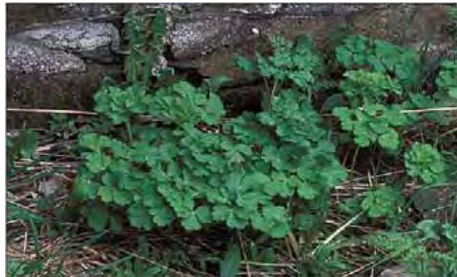
Blomsterform og farge varierer; nyanse av blått er vanligst. Akeleie kan dukke opp hvor som helst i hagen, gjerne inntil murer og husvegger. Bladene kommer tidlig om våren.