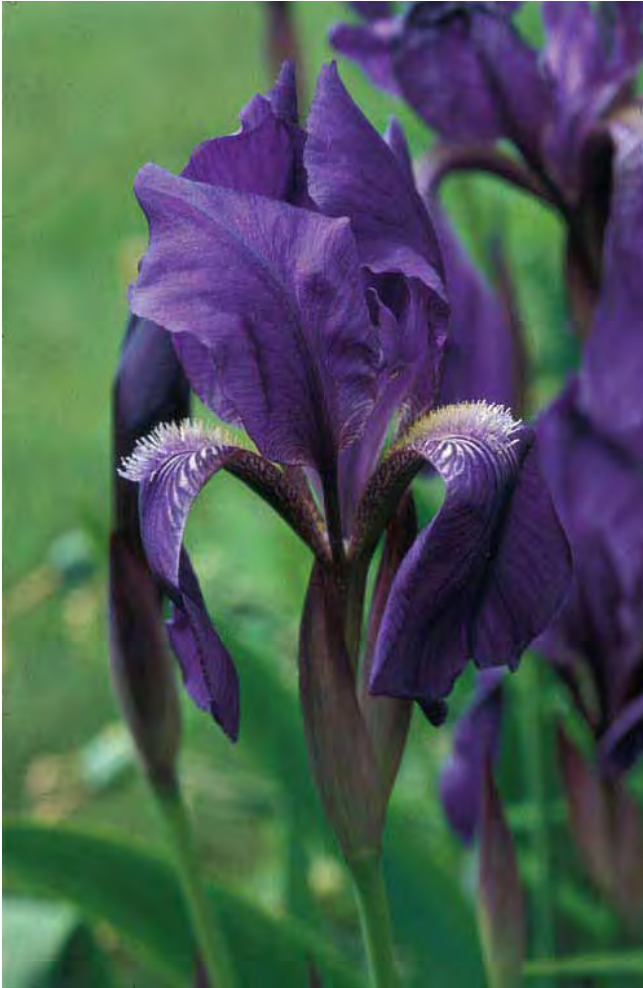
Hageiris-gruppen kjennes på de store, brede blomstene med "skjegg" på de nedre, hengende blomsterbladene.