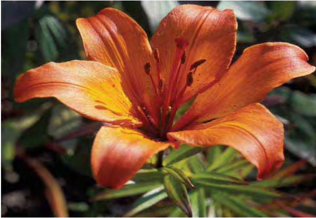
Brannlilje er en av de vanligste hageplantene i Midt-Norge. Blomsten varierer en del i form, farge og mønster.