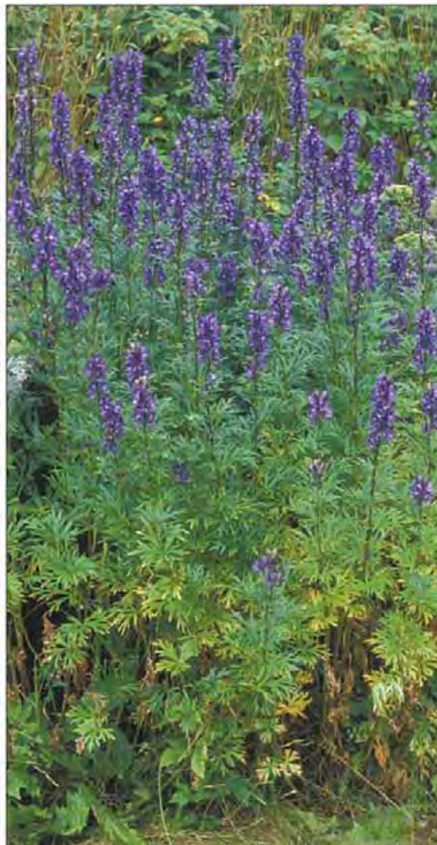
Den vanligste formen av prakthjelm har stivt opprette stengler med blomster i tett klase. Mørkeblå blomster er vanligst, men blå/hvite forekommer, især på former med sterkt grenet stengel.