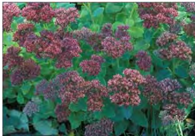
Oktoberbergknapp har matte, lyse farger i blomsterstand og på blad.