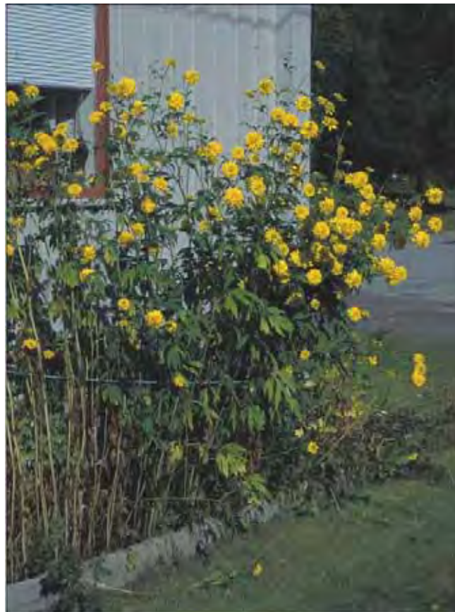
Gjerdeshatt trenger noe å støtte seg på.

Over to meter høy stengel, grenet i den øvre delen, med dypt flikete blad. Opptil 10 cm brede, gule blomsterkurver som i hageformene vanligvis er fylte. Blomstrer sensommers. Planter inntil gjerder og husvegger fordi den ofte trenger å bindes opp. Dyrket siden 1700-tallet. Tilhører kurvplantefamilien Asteraceae . Kalles også "kyss meg over gjerdet".