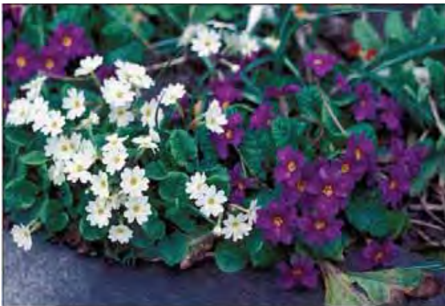
Edelnøkleblom finnes i flere farger.

Arten kaukasusnøkleblom Primula juliae er ikke mye dyrket, men en hybrid, x pruhonica er svært vanlig. Skiller seg fra arten ved å være både kraftigere og mer robust. Teppedannende med rødlig blomster, forekommer i mange fargenyanser. Bladene er "rynket". En god fjellhage- og kantplante som gjerne vil ha fuktig, litt tung jord og ikke for mye sol. Bør deles og plantes om fra tid til annen. Tilhører nøkleblomfamilien Primulaceae .