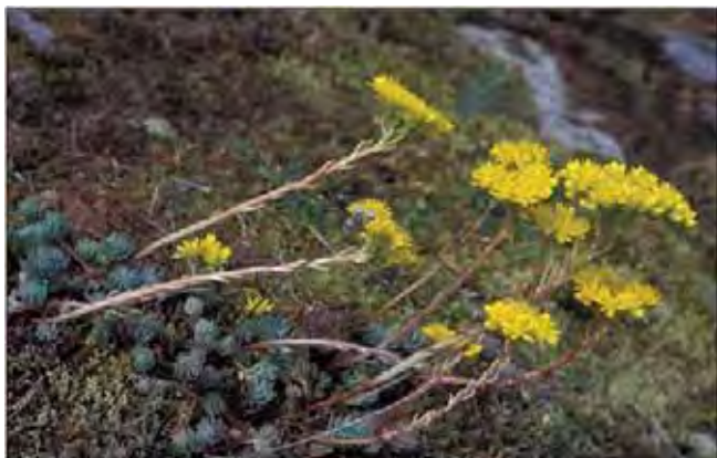
Broddbergknapp vokser i naturen på berg og vil helst ha lignende voksesteder også i hagen.

Konglebergknapp Sedum forsterianum ligner broddbergknapp, men bladene er flate på oversiden og sitter tett sammen i små "baller" i enden av skuddene. Visne blad henger lenge på. Det er uvisst hvor vanlig denne er i hagene i Midt-Norge. Fra Vest-Europa. Bergknapp-artene har antakelig blitt dyrket fra 1800-tallet.