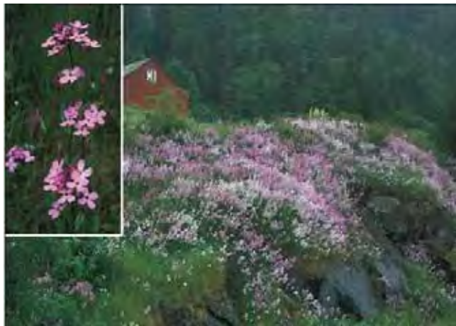
Dagfiol finnes i mange hager, men står flottare utenom hagene, særlig i veiskråninger. Fra Rissa i Sør-Trøndelag.

Meterhøye stengler med stilkede, avlange, spisse, grovt tannete og hårete blad og store blomster i toppen, i flere nyanser av lilla. Dufter utpå kvelden. Blomstrer fra forsommeren til midtsommers og står mange steder i mengder i skog- og veikanter og på skrote mark. Mange kjenner dagfiol bedre fra slike steder enn som hageplante. Dyrket siden renessansen. Fra Sør- og Øst-Europa og Vest-Asia. Tilhører korsblomstfamilien Brassicaceae .