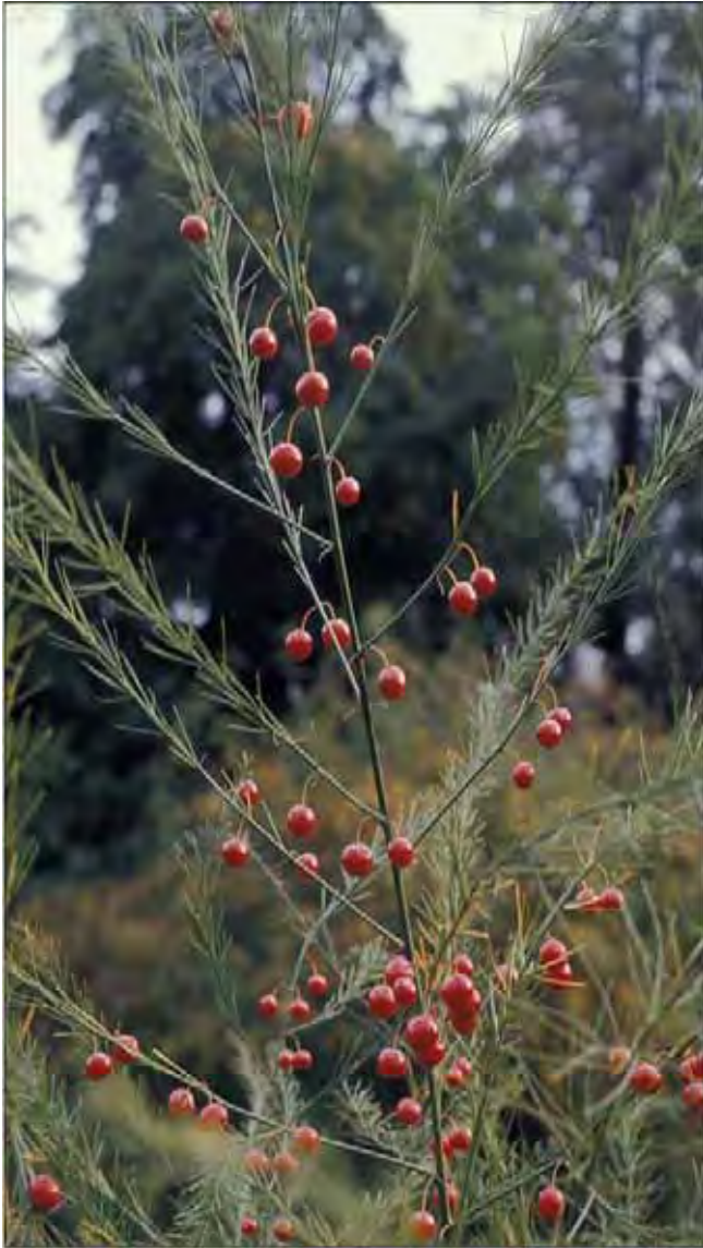
Asparges med røde bær; uforenlig med asparges som grønnsak!