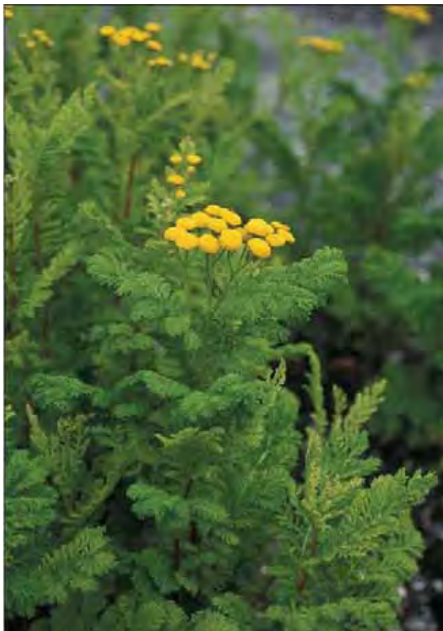
Den krusete formen av reinfann er blitt sjelden i hagen.

Stive stengler med fint fjærdelte blad og mange små, gule kurver uten kantkroner, i halvskjerm. Særlig interessant fra et kulturhistorisk synspunkt er en form med sterkt findelte blad (krusete, f. crispum ). Begge formene har vært dyrket siden middelalderen. Rein fann er vanlig i midtnorske hager, men den krusete formen var trolig mye vanligere et par generasjoner tilbake. En eurasiatisk art som vokser vilt i storparten av Norge og ofte er tatt inn til hager fra naturen. Tilhører kurvplantefamilien Asteraceae .