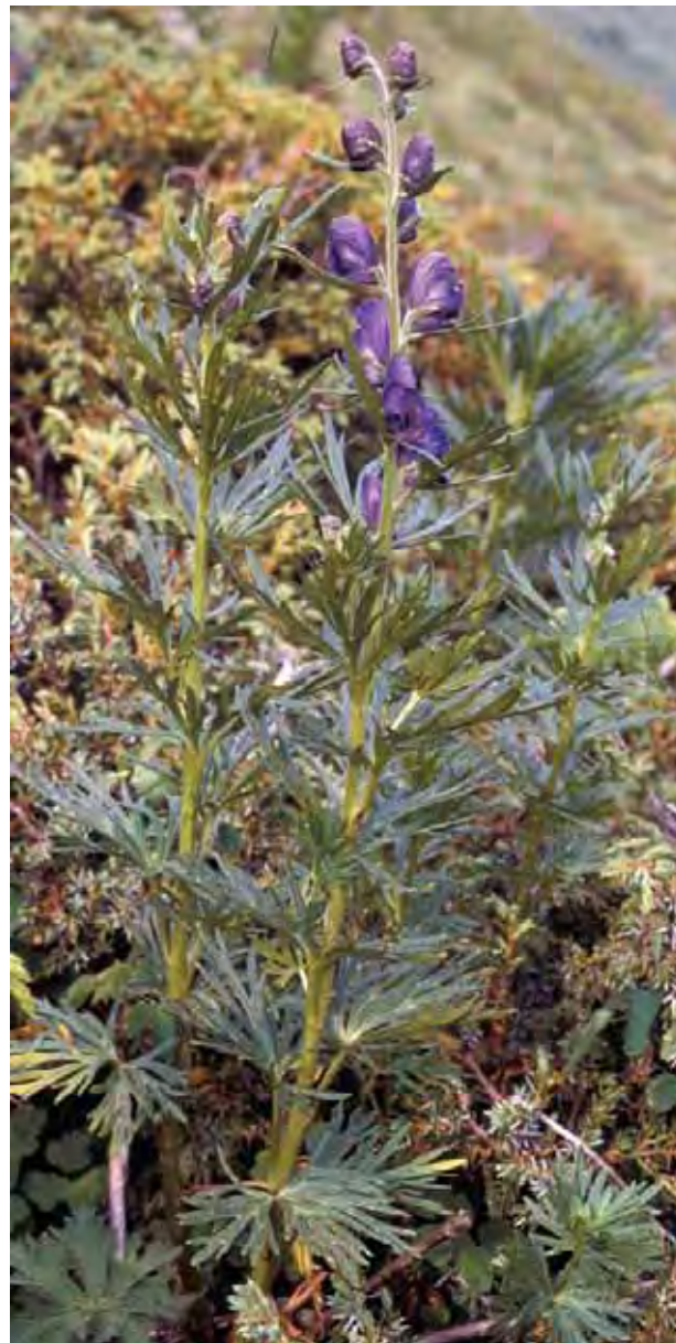
Storhjelm i sitt rette element, i Alpene. Blomsten er fiolett og hårete.