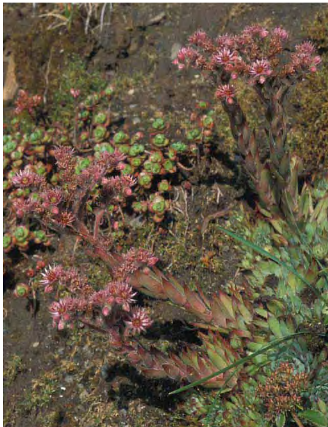
Takløk vokser på de tørreste bergene, gjerne sammen med bergknapparter.

Tette rosetter av brede, stive, saftige blad. Fra rosetten kommer en stengel med avlange blad og en kvast med mørkt rosa blomster. Dyrket siden middelalderen, bl.a. plantet på torvtak som brann-dempende tiltak. Fra Mellom- og Sør-Europa. Tilhører bergknappfamilien Crassulaceae .