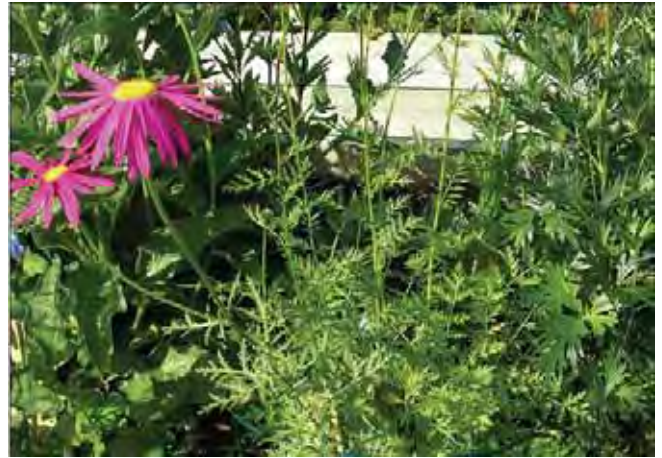
Rosekrage er ikke så vanlig i nyere hager.

Opprette stengler med fjærflikete blad og en stor, rosa og gul "blomst" (kurv). Mange sorter finnes, med fargevariasjoner fra hvitt til rødt, også delvis fylte og fylte former. Dyrket siden 1800-tallet. Fra Kaukasus. Tilhører kurvplantefamilien Asteraceae . Tidligere kalt bl.a. Pyrethrum roseum og Chrysanthemum coccineum .