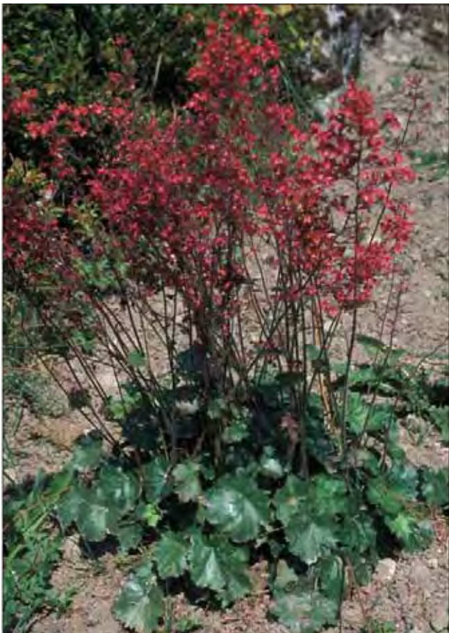
Alunrot er lett å kjenne som slekt, men variasjonen i midnorske hager er ikke klarlagt.

helt til i dag, men den er også brukt senere i engfrøblandinger og bed. Finnes av og til forvillet i enger og skogkanter. Fra Mellom-Europa. Tilhører kurvplantefamilien Asteraceae .