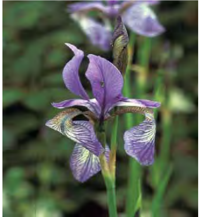
Sibiriris-gruppen har en noe smalere blomst enn hageiris og mangler "skjegg", men har derimot et tydelig åremønster på de nedre, hengende blomsterbladene.

Blomstene mangler "skjegg" på de ytre blomsterbladene. Tynnere jordstengler enn hos hageiris og danner kompakte tuer. Smalere (ca. 1 cm brede), rent grønne og opprette blad. Blir over 1 m høy. Klarblå blomster med markerte tegninger i mørkeblått, gult og hvitt på de ytre (nedre) blomsterbladene. Ofte flere blomster sammen. Fra Øst-Europa og Vest-Asia.