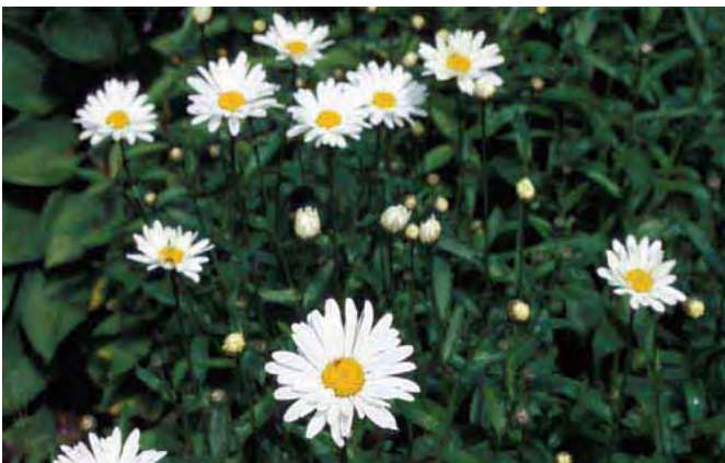
Kjempekrage er som en stor prestekrage. Den kan bli mye "fetere" enn på dette bildet og danne store, hvelvede "busker".

En hagehybrid som ser ut som en stor prestekrage, men skiller seg fra den viltvoksende arten ved å ha større, kileformede, tykke blad og blomster som blir opptil 10 cm i diameter. Fylte former finnes. Dyrket siden 1900-tallet. Foreldreartene fra Sørvest-Europa. Tilhører kurvplantefamilien Asteraceae .