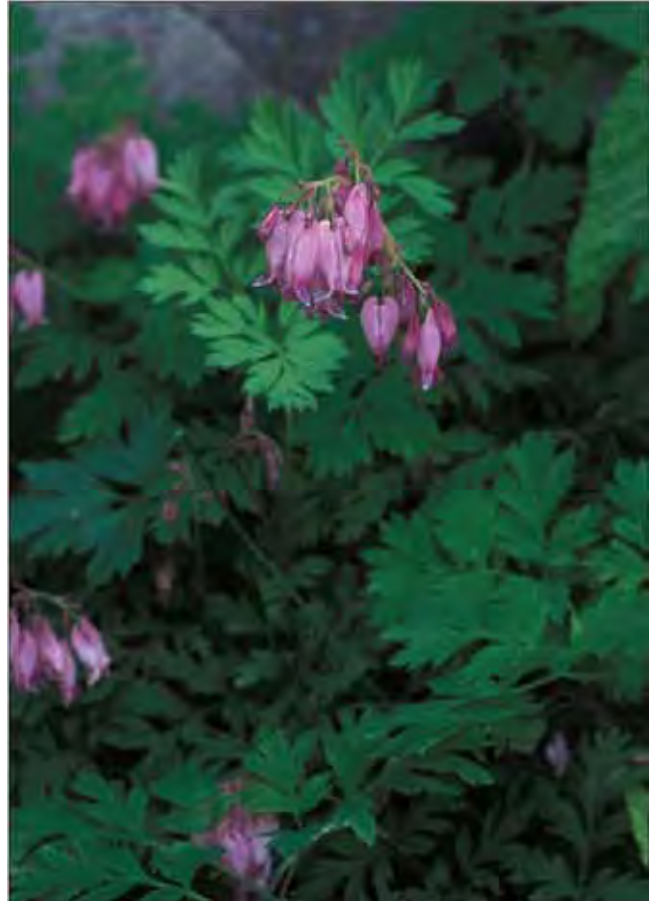
Småhjerte tåler å vokse i halvskygge innunder andre stauder.

30-40 cm høy med flikete blader som er meget mer oppdelt enn hos den større løytnantshjerte. Nikkende eller opprette, rosa, "flatklemte" blomster. Tåler noe skygge. Ble vanlig som hageplante i Norge på 1800-tallet. Fra vestlige Nord-Amerika. Tilhører jordrøykfamilien Fumariaceae .