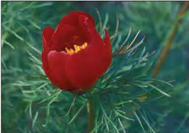
Trådpion er lite dyrket, men blomster og blad er iøynefallende.