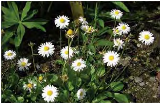
Tusenfryd kan dominere en plen. I særlig vintermilde strøk kan tusenfryd blomstre hele året.

"Blomst" (kurv) med hvite/rosa kantkroner og gule midtkroner, én kurv i toppen av hver stilk på ca. 7-10 cm. Bladrosetten brer seg ut i bakkenivå. Egner seg godt som kantplante, men mest effekt har den som innslag i gressplen. Det finnes mange sorter av tusenfryd som er mer spektakulære enn arten, med blomster fra knapplignende til store, bustete. Disse passer best som kantplanter i bed; i plener skal tusenfryd tradisjonelt være små og rosa/hvite. Dyrket siden renessansen. Vanligere i plener og enger i ytre kyststrøk enn innover i fjordene. Det er usikkert om tusenfryd er opprinnelig viltvoksende langs kysten, eller om den er forvillet. Fra Europa og Vest-Asia. Tilhører kurvplante-familien Asteraceae .