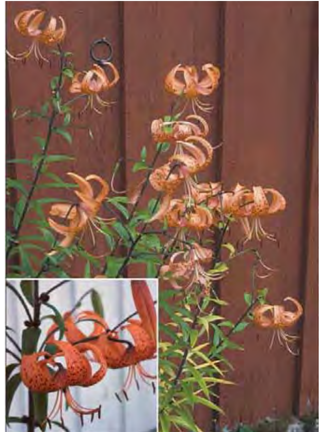
Tigerlilje plantes gjerne opp mot vegger. På detaljbildet ses bulbiller i bladhjørnene.

Over meterhøye stengler med skruestilte, smale, mørkegrønne og blanke blad. Ved grunnen av bladene sitter rikelig med fiolett-svarte bulbiller (yngleknopper) som faller ned fra morplanten og kan spire til nye planter (vegetativ forering). Oransje, hengende blomster med oppoverbøyde blomsterblad med mørke flekker og røde støvbærere på lange støvtråder. Blomstrer senere (august-september) enn andre liljer i midtnorske hager. Har trolig vært vanligere før, men kan dyrkes i hele landsdelen. Dyrket siden 1800-tallet. Fra Øst-Asia.