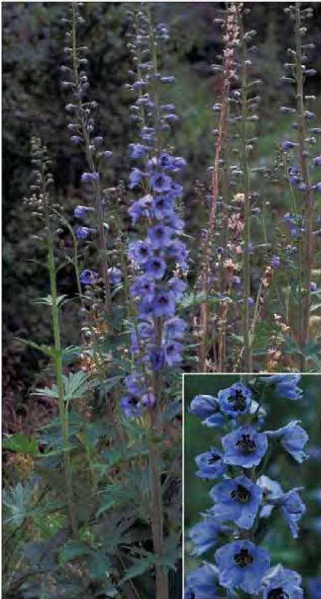
Hageridderspore er så hardfør at den i mange år har holdt stand i hagen til Kongsvoll fjellstue, 900 moh.