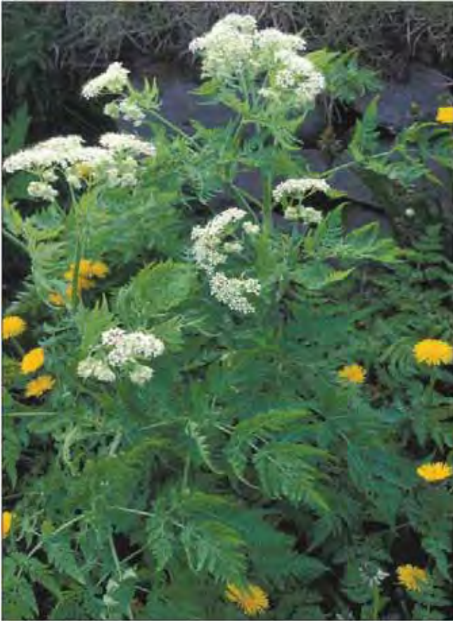
Spansk kjørvel.

middelalderen. Fra Mellom- og Sør-Europa. Tilhører skjermplantefamilien Apiaceae .