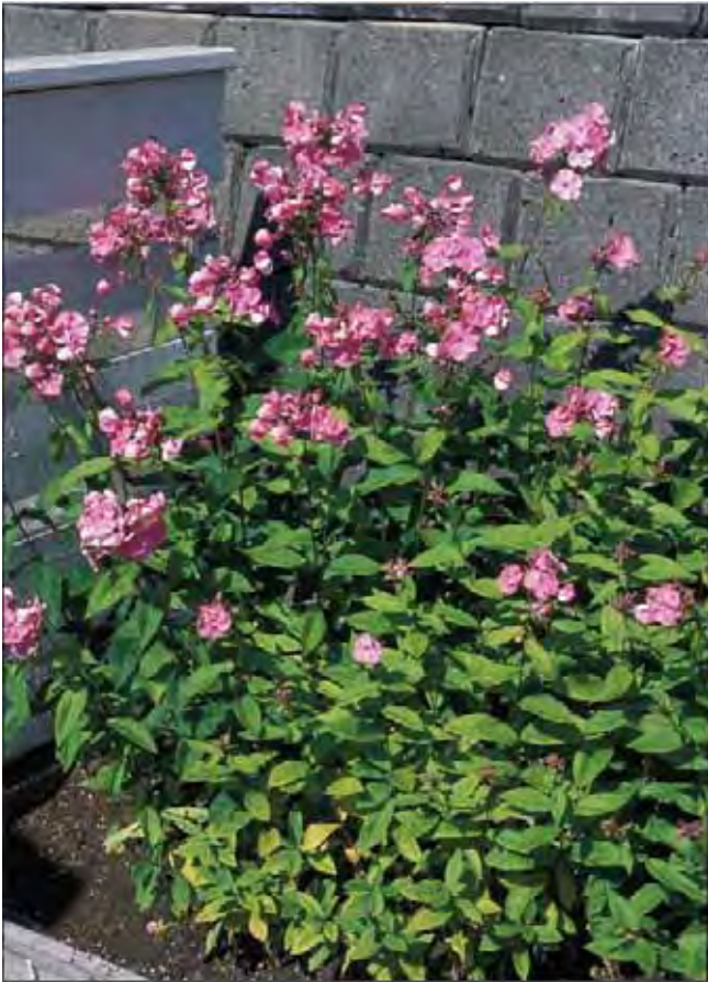
Denne skarpt rosa formen av høstfloks er en av de vanligste i Midt-Norge. Her er en gammel plante tatt med til et nytt bed.