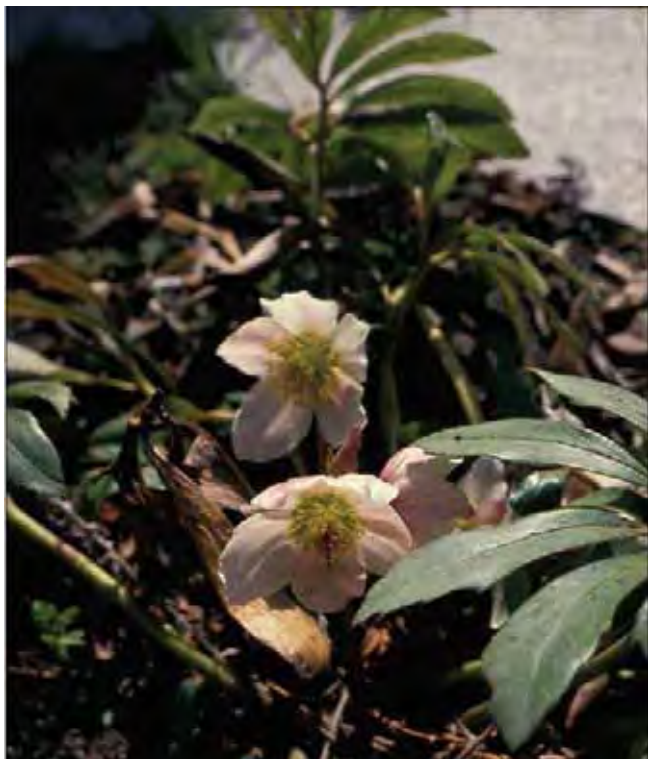
Julerose kan blomstre midtvinters i kystområdene.

Flere arter av julerose dyrkes, men den hvitblomstrede Helleborus niger er vanligst. Den er 15-30 cm høy, med læraktige, vintergrønne, hånddelte blad. Store, hvite blomster, noen få på hver stilk, sitter lavere enn bladene, blir etter hvert rødgrønne. Blomstrer normalt i mars-april, men i mildt klima kan den blomstre til jul – derav det norske navnet. Det vitenskapelige navnet niger (svart) henspeiler på den svarte rotstokken. Er mest brukt i kyststrøkene, sjeldnere i lavlandet lenger inn i landet, men er kjent fra flere hager i Trondheim-området. Dyrket siden middelalderen, ikke minst som gift- og medisinsplante. Fra Mellom- og Sør-Europa. Tilhører soleiefamilien Ranunculaceae .