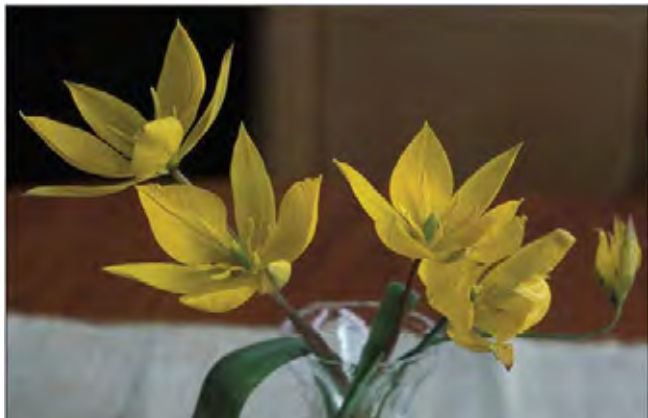
Villtulipan er fin også som snittblomst.

Fra løken kommer 2-3 smale, blågrønne blad og tynne stengler med én enkelt åpen, gul blomst med spisse blomsterblader. Ikke særlig vanlig i midtnorske hager, men kan spre seg ut i plener. Finnes flere steder forvillet i Sør-Norge. Dyrket siden middelalderen. Fra Sør-Europa, Kaukasus og Nord-Afrika. Tilhører liljefamilien Liliaceae .