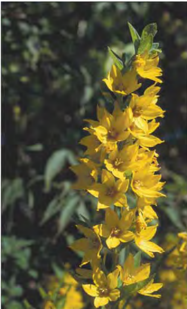
Fagerfredløs lyser godt opp i hagene og er svært utbredt.