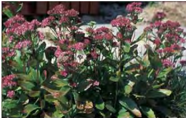
Hagesmørbukk har blankere blad enn oktoberbergknapp og har ofte sterk rødfarge på alle deler av planten.

Ca. 40 cm høy stengel med motsatte, brede, lyst grågrønne blad med kileformet grunn. Blomster matt rosa. Hele planten har en "dempet" fargetone. Blomstrer sensommers. Nokså vanlig i midtnorske hager, oftest i bed med andre stauder. Fra Kina. Kalles også høstbergknapp.