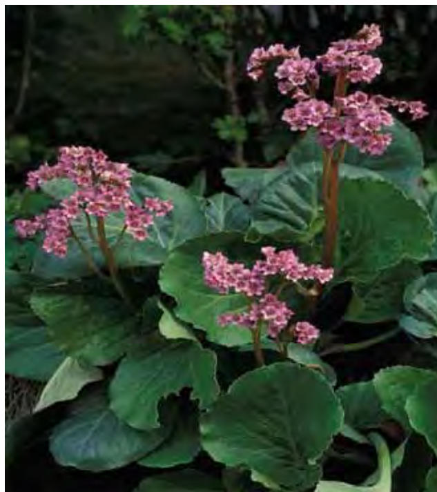
En skal studere bergblom på kloss hold for å skjelle artene hverandre.

Avsmalnende bladgrunn, korte bladskaft, beger bredt kjegleformet kronblad smale og overlapper lite.