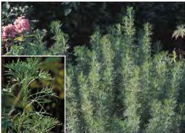
Abrodd er gått ut av bruk, men fyller godt opp bedene.

Ca. 1 m høy busk med oppstående grener (som er forvedet nederst) med fint oppdelte, gråhårete blad. Ses sjelden i blomst. Har aromatisk lukt som førte til at den ble anvendt som møllmiddel. I gamle dager ble den også brukt i "kirkebuketter". Noe godlukt kom vel godt med når gudstjenestene varte lenge. En tradisjonsrik plante som nå nesten ikke er i bruk og som få er kjent med. Det er uvisst hvor abrodd kommer fra opprinnelig. Tilhører kurvplantefamilien Asteraceae og samme slekt som malurt, estragon og burot.