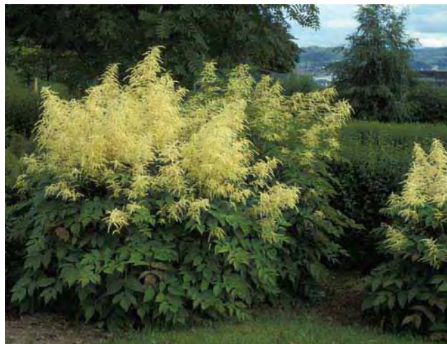
Skogskjegg gjør seg godt som solitærplante.

Høye stengler som vokser i tette klynger og har to ganger finnete blad med tannete småblad. I toppen av stenglene store blomsterstander med gulhvite blomster, med hunn- og hannblomster på særskilte planter (særbu). En svær staude som plantes i bed, som solitærplante i plener og som hekk. Dyrket siden 1700-tallet. En av de aller vanligste staudene i Midt-Norge og ofte forvillet i vei- og skogkanter. Fra Mellom-Europa, store deler av Asia og vestlige Nord-Amerika. Tilhører rosefamilien Rosaceae .