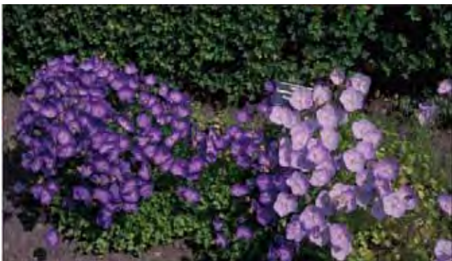
Karpatklokke kan variere bl.a. i blomstenes størrelse og farge.

20-30 cm høye, greinete og noe nedliggende stengler som gir den puteform. Myke, hjerteformede blad med butte tenner og mange bredt klokkeformete, opprette blomster. Dyrket siden 1800-tallet. Mye brukt i hagene i dag, men det er sjelden å finne gamle planter av karpatklokke. Fra Øst-Europa. Tilhører klokkefamilien Campanulaceae .