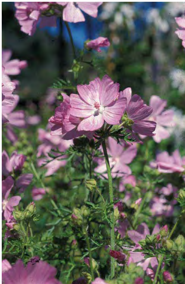
Moskuskattost har enten rosa eller hvite blomster.

”gammeldags” staude, som ser ut til å tape terreng i hagesammenheng. Plantene er ikke særlig langlivete, men de sår seg lett og forvilles i Sør-Norge. På beitemark blir den ikke spist; siden den ikke er giftig, er det kanskje den moskuslignende duften av bladene som avskrekker. Duften er såpass svak at våre neser ikke blir plaget. Fra Mellom- og Sør-Europa. Tilhører kattostfamilien Malvaceae .