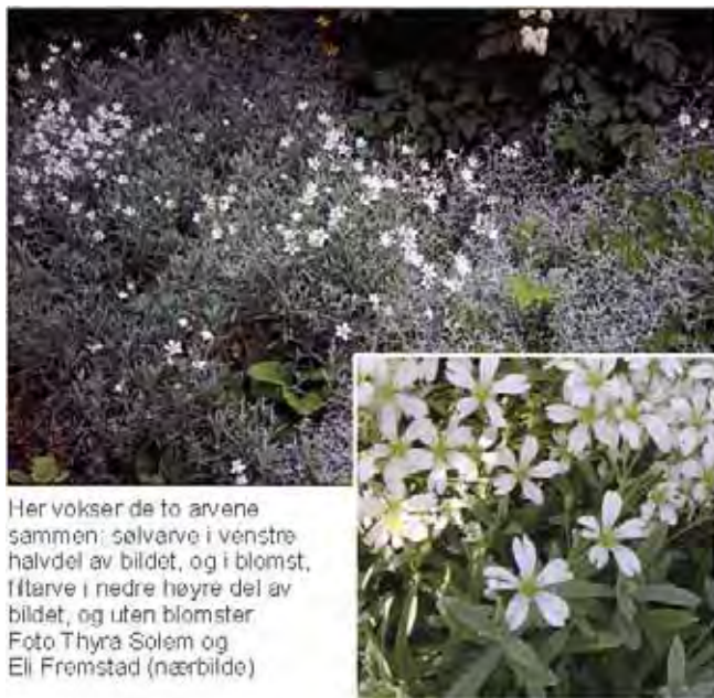
Her vokser de to arvene sammen: sølvarve i venstre halvdel av bildet, og i blomst, filtårve i nedre høyre del av bildet, og uten blomster Foto Thyra Solem og Eli Fremstad (nærbilde)

Blad 2-5 cm lange, blomstene ca. 3 cm brede. Fra Svartehavsområdet.