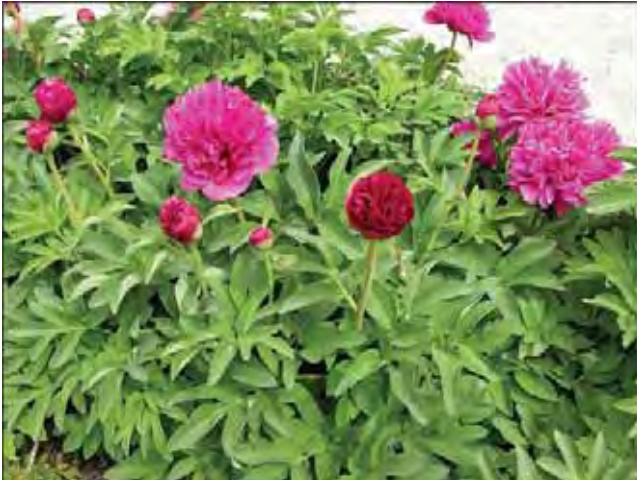
En bondepion (?) med mørk rosa, fylte blomster. Denne sorten blomstrer tidlig.