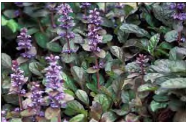
Krypjonsokkoll kan dekke jorda i bed.

Lave, krypende skudd med avlange, stilkete blad og opprett stengel med små, lilla blomster i et kort aks. Hele planten er gjerne noe fiolettfarvet. Mye brukt som bunndekke i bed og finnes av og til i plener. Dyrket siden 1800-tallet. Fra Europa, Nord-Afrika og Vest-Asia. Tilhører leppeblomstfamilien Lamiaceae .