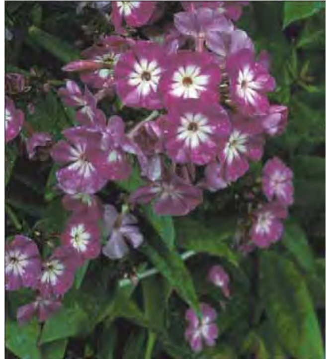
Tofargete høstfloks i nyanser av rosa/rødt og hvitt er sjeldnere enn ensfargete.