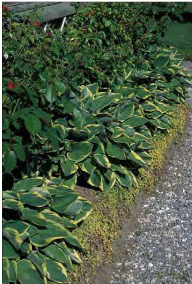
Det er etter hvert kommet en mengde sorter av bladliljer med tofargete blad. De brukes ofte som kantplanter.