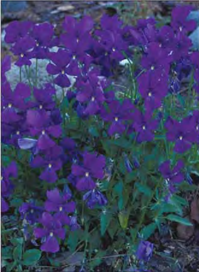
Hornfiol finnes i mange nyanser av blått, her i en svært mørk form.