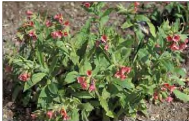
Rød lungeurt, der blomstene ikke endrer farge.

Røde blomster som ikke endrer farge. Bladplaten smalner tvert mot bladstilken; bladplate og -stilk er jevnlange. Grønne, uflekkede blad med ujevn kant. Bladene dekker marka godt og holder seg pene gjennom sesongen. Fra Øst- og Sørøst-Europa.