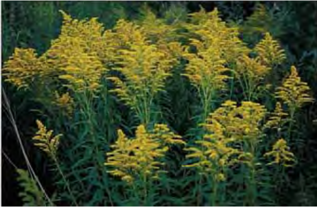
Kanadagullris lyser godt opp i et mørkt hagehjørne.