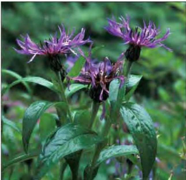
Honningknoppurt er hardfør og dekorativ og kan dyrkes i alle deler av Midt-Norge. Foto Thyra Solem

Ugrenet stengel med avlange blad og én "blomst" (kurv) med lange, blå kantkroner, brålik en stor, grov kornblomst. Er villig og kan være vanskelig å bli kvitt når den dukker opp på uønskede steder i hagen. Svært mye brukt i hele landsdelen og finnes ofte forvillet i veikanter. Har en lei tendens til bli dekket av meldugg utover sommeren, men da er den ferdig med blomstringen og kan klippes ned. Dyrket siden renesansen. Kommer fra Mellom- og Sør-Europa og Vest-Asia. Tilhører kurvplantefamilien Asteraceae .