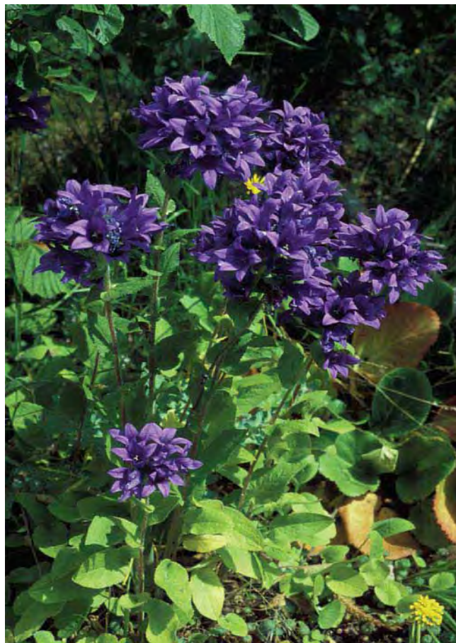
Toppklokke er en robust plante som kan dyrkes i alle deler av Midt-Norge.

Har en nesten kuleformet samling av mørkt blåfiolette, oppoverrettede klokker i toppen av en ca. 30 cm lang stengel. Blad langsmalt ovale, brer seg ut i bakkenivå. Blir bladteppet for tett og kompakt, går det ut over blomstringen, så det lønner seg å holde den litt i sjakk. Hører med til standardinventaret i eldre hager, der den ofte har betydelig alder. Dyrket fra 1900-tallet. Fra Europa og Vest-Sibir. Tilhører klokkefamilien Campanulaceae .