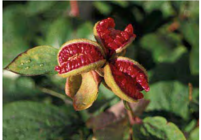
Belgkapslene til pioner kan være dekorative. Denne er fra Paeonia mlokosiewitschi .