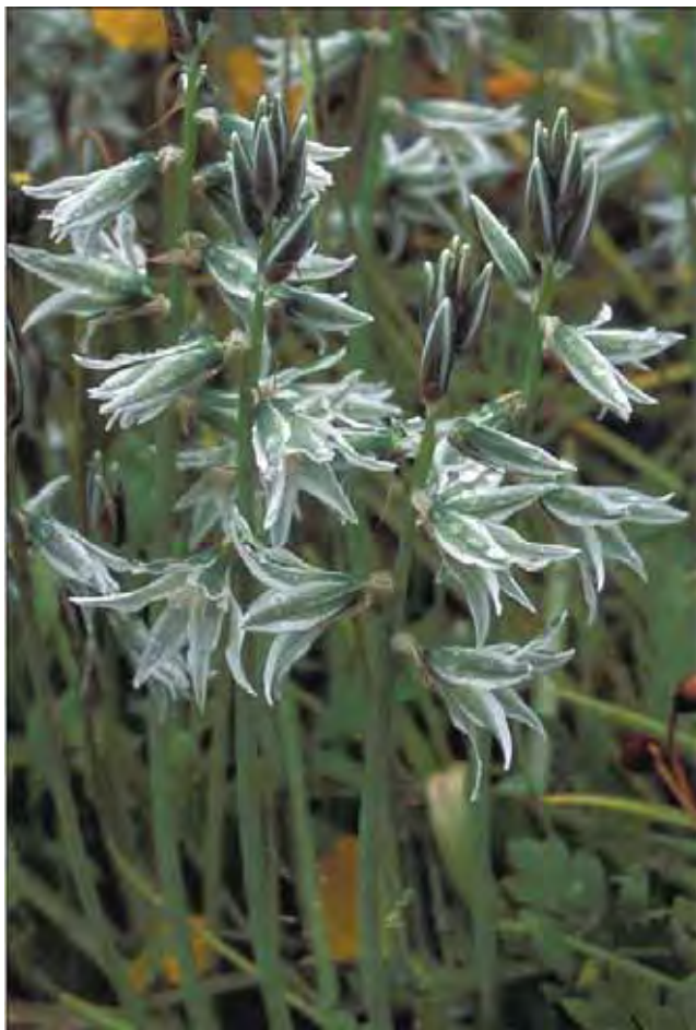
Nikkestjerne har dempede farger, men er dekorativ likevel.

Tidligblomstrende løkplante med nikkende, ganske uanselige, grønn- og hvitstripete, klokkeformete blomster som vender til samme side. Gjør seg godt når det er mye av den. Har muligens vært dyrket i lange tider, men er meget sjelden i midtnorske hager i dag. Som kuriositet kan nevnes at den i en løk-katalog fra 2004 ble lansert som nyhet! Fra Sørøst-Europa og Vest-Asia. Tilhører hyasintfamilien Hyacinthaceae .