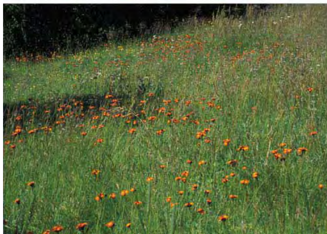
Hagesvæve kan stå i bed, men forekommer også i enkelte enger nær bebyggelse. Fra Leksvik i Nord-Trøndelag.