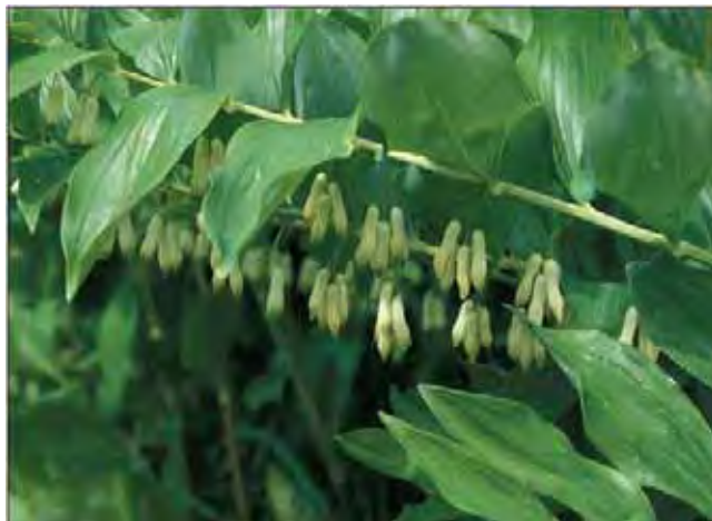
Storkonvall fyller godt opp i bed og kan godt stå som solitærplante. Blomstene gir svarte bær.

Lange, bøydde stengler fra kraftige jordstengler. Ovale blad med linjeformede nerver. Bladene står ut fra stengelen, mens de grønnhvite, smalt klokkeformede blomstene henger ned fra bladhjørnene, 2-4 sammen. Meget robust art som det kan være vanskelig å holde i sjakk. Står ofte igjen på nedlagte bruk. Dyrket siden renessansen. En eurasiatisk art, viltvoksende i Sør-Norge. Tilhører konvallfamilien Convallariaceae .