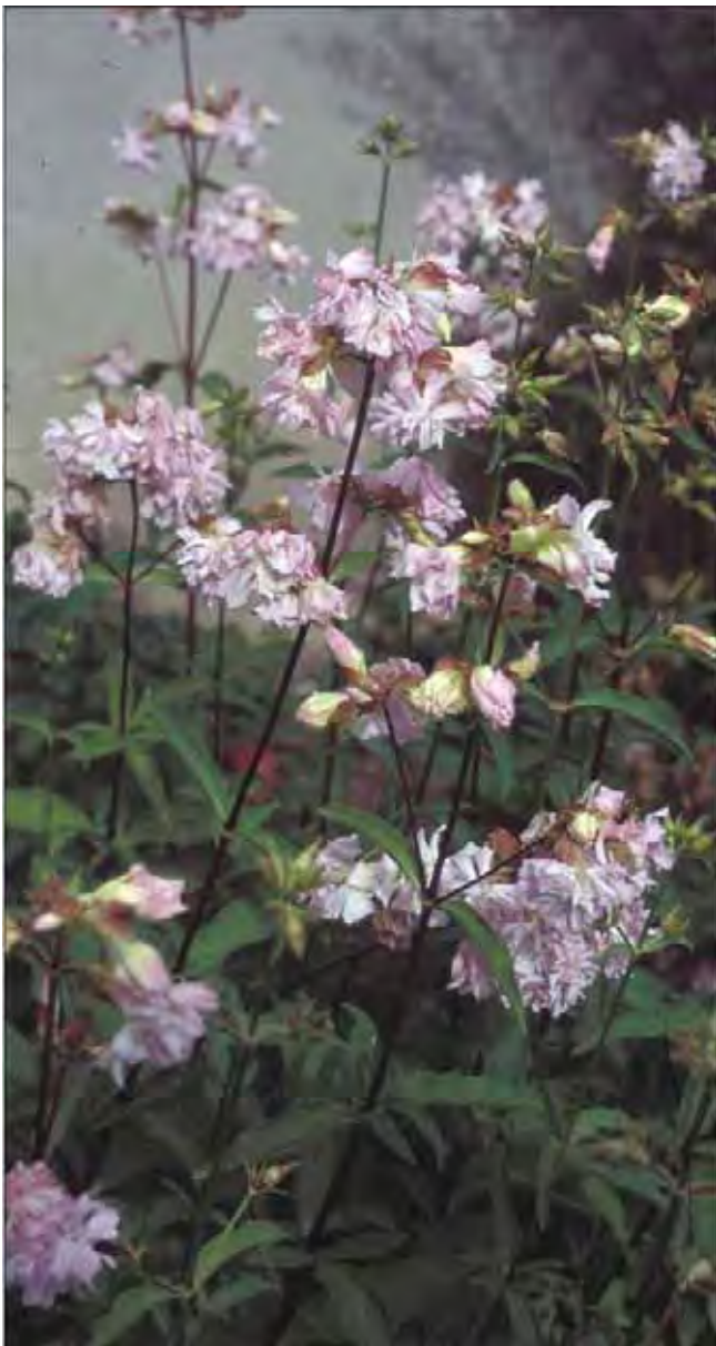
Såpeurt finnes med enkle og fylte blomster. Den kan ha bredere blad enn den har på bildet.