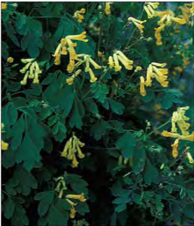
Gul lerkespore kan henge over steiner og berg, men også stå i stauvedet.