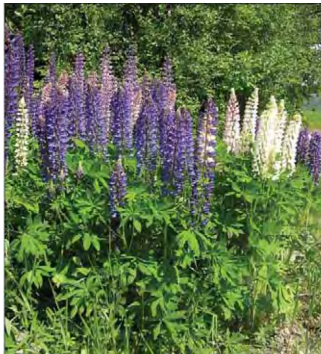
Masser av hagelupin i blomst er et flott syn enten det er i hager eller veikanter.

De svære mengdene med lupiner langs veikanter og på skrotemark skyldes i noen grad spredning fra hager, men mest utsåing av veimyndigheter og/eller deres underleverandører.