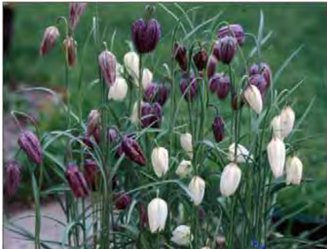
Rutelilje er svært dekorativ når det er mye av den.

Smale, opprette blad og en enkelt (eller et par) hengende, klokkeformete blomster med karakteristisk rutemønster i gråfiolett eller lilla. Hvite blomster er også vanlig. Dyrket siden middelalderen og var vanligere på 1700-tallet enn den er i dag. For noen generasjoner siden fantes den forvillet flere steder i Trondheim. Nå er den sjelden i hagene i Midt-Norge, og det som finnes er antakelig mest nyanskaffet materiale. En europeisk art. Tilhører liljefamilien Liliaceae .