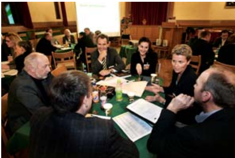
Samling for nyskaping i Midt-Norge 21. november 2006 med utvalgte ledere fra akademia og næringsliv