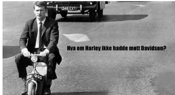
Det ble satset mye på profilering av partnerskapet. Dette motivet var blikkfang på Innovators plakater/nettside