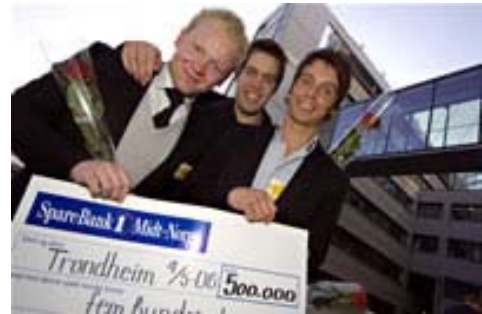
SEC og Vireo fikk 500 000 kroner hver fra Sparebank 1 Midt-Norge StartStøtte