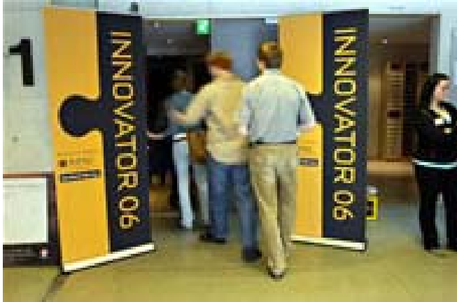
Nyskappingsfesten Innovator samlet 400 deltagere.