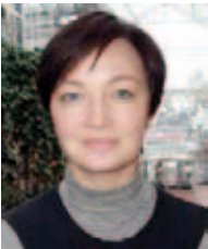
Malin Noem Ravn Institutt for tverrfaglige kulturstudier, NTNU