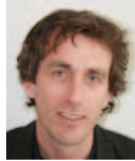
Berge Solberg Institutt for samfunns- medisin, NTNU