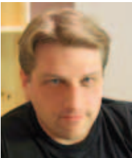
Bjørn K. Alsberg Institutt for kjemi, NTNU