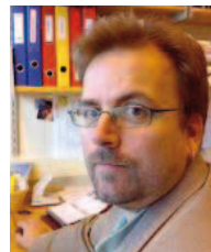
Arve Hjelseth Institutt for sosiologi og statsvitenskap, NTNU