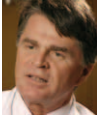
Arne Sunde Institutt for laboratorie- medisin, barne- og kvinnesykdommer, NTNU