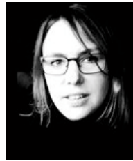
Ellen Ersfjord Senter for barneforskning, NTNU