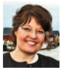
Hilde Murvold Museet Kystens Arv