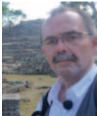
Olaf Husby Institutt for språk og kommunikasjonsvitenskap, NTNU