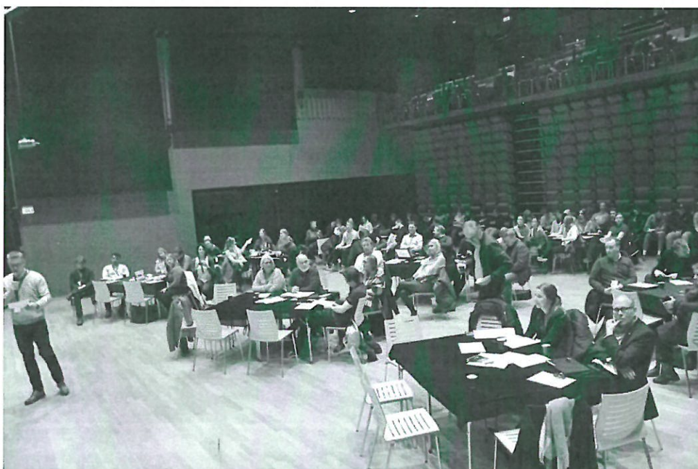
Godt over 100 personer var på plass for å høre om mulighetene ved en blå revolusjon som kan bølge inn over Fosen.

- Det er veldig hyggelig at dere utforsker vår region. Både Bjugn og Fosen er kapitalsvakt. Det betyr at vi er nødt til å være smarte og legge til rette for næringslivet. Omsetningen i maritim sektor bare i Bjugn er på over 4,5 milliarder kroner. Næringen er viktig for oss som region, sier Undertun.