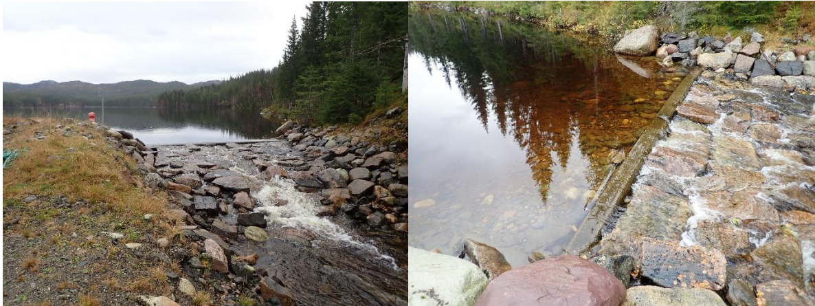
Bilde: Terskelen ved demningen på utløpet av Ausvatnet.