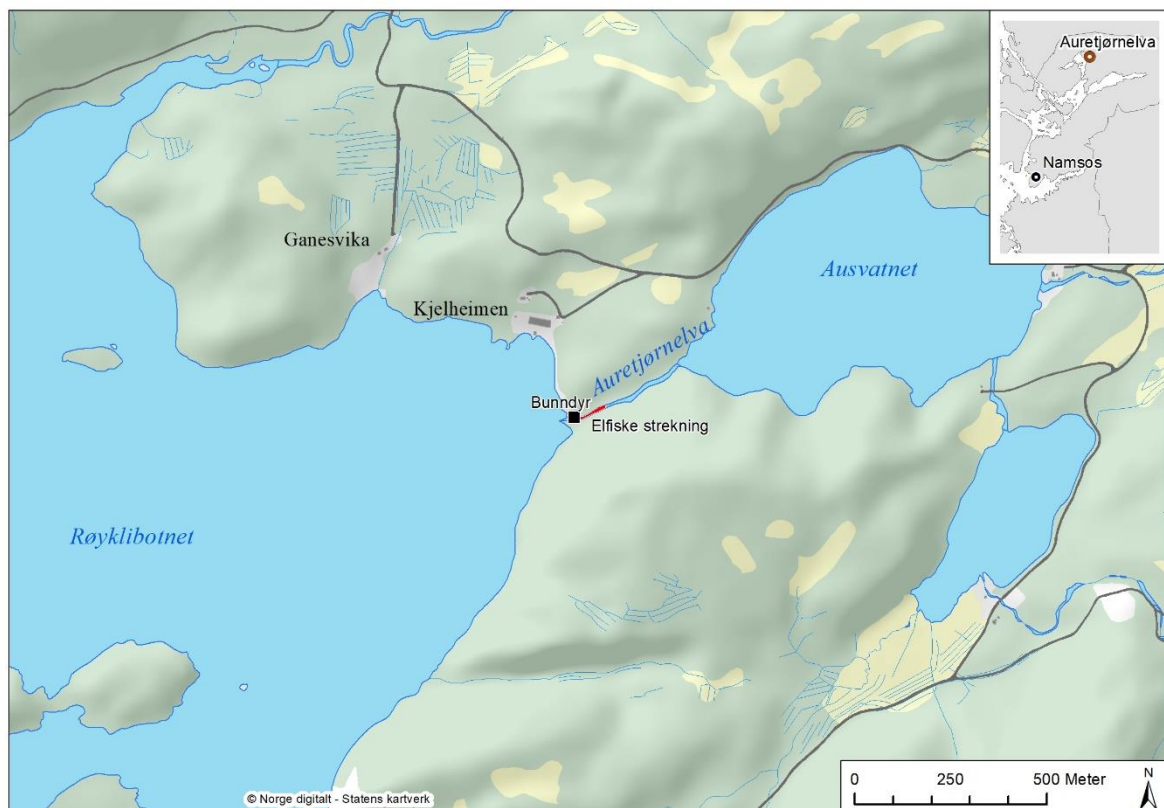
Bilde: Kart over Auretjørnelva med elfiskestrekning (markert med rødt) og bunndyrstasjon.

Det finnes ørret ( Salmo trutta ), røye ( Salvelinus alpinus ) og ål ( Anguilla anguilla ) i Auretjørnelva. Vassdraget hadde tidligere bestander av sjørret og laks ( Salmo salar ) som kunne vandre opp i Ausvatnet. Disse bestandene er i dag tapt på grunn av tidligere tømmerfløting og etablering av fiskesperre ved utløpet av Ausvatnet. Det har ikke gått opp anadrom fisk til Ausvatnet på 60-70 år (Gorseth 2008). Neptun Settefisk AS har konsesjon (30.06.2010) på vannuttak på inntil 313 l/s fra Ausvatnet, samt regulering av Ausvatnet og Sommerhustjønna. Regulerings høyden er på 2,5 meter i Ausvatnet og på 1 meter i Sommerhustjønna. Det er krav om minstevannføring hele året på 50 l/s fra Ausvatnet (til Auretjørnelva) og 20 l/s fra Sommerhustjønna. Av hensyn til storlom ( Gavia arctica ) er det satt krav om høy og stabil vannstand i Ausvatnet i perioden 01.05-30.06. Det har vært satt krav om at fiskesperren skulle fjernes innen 30.06.2013 og at det skulle legges til rette for oppgang av laks og sjørret forbi dammene i vassdraget.