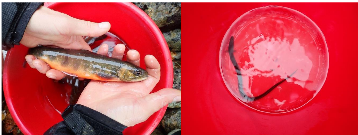
Bilde: Røye (t.v) og ål (t.h.) fanget i Auretjørnelva 2018.