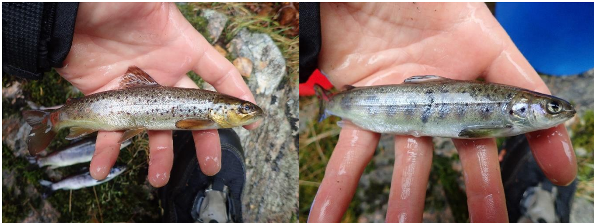
Bilde: Ørret (t.v.) og settefisk av laks (t.h.) fanget i Auretjørnelva 2018.

Det ble fanget 14 ørret med lengder på 7,3-27,5 cm på strekningen i nedre deler, noe som tilsvarer en estimert tetthet på 4,5 fisk/100 m 2 . Noe av fisken ble aldersbestemt, og hadde alder på 1-3 år. De største ørretene på over 20 cm antas å være 4-5 år gamle. Det ble ikke registrert noen årsyngel av ørret. Under elfiske i øvre deler av elva ble det kun fanget en ørret på 25 cm.