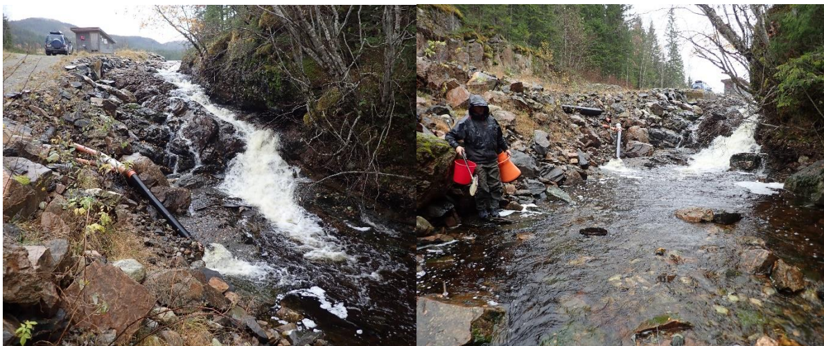
Bilde: Fossen i øvre deler av elva like nedstrøms Ausvatnet. Pålagte minstevannføring slippes via plastrør til venstre på bildene.

Demningen ved Ausvatnet har en terskel i betong. Nedstrøms terskelen er det lagt ned tett forbygning med blokkstein. Både terskelen og forbygningen er lite gunstig bygd med tanke på oppvandring av fisk. Fisk kan muligens vandre forbi her på veldig høy vannføring, men terskel og forbygning utgjør på de fleste vannføringer et absolutt vandringshinder for anadrom fisk.