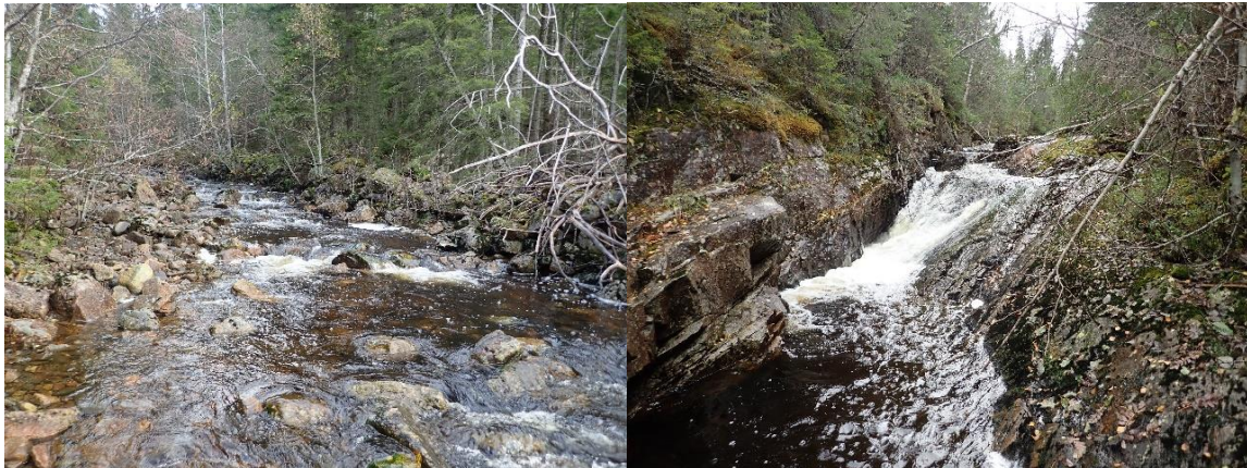
Bilde: Nedre deler av anadrom strekning ved bunndyrstasjon (t.v.) og fossen i nedre deler øverst på strekingen som ble elfisket (t.h.)

Auretjørnelva domineres av stryk med grovt substrat hele veien fra flomålet og opp til Ausvatnet. Strekingen som ble elfisket i nedre deler av elva (fra flomålet og opp til en foss) består stort sett av stryk, og er 2-7 meter bred. Enkelte høl er opp til 1,5 meter dype. Substrat domineres av stor stein, blokk og berg. Det er lite mindre stein og grus, og derfor svært begrensede gytemuligheter på strekingen. Fossen øverst på strekingen utgjør et vandringshinder for fisk på lav vannføring. Elva er lite begrodd av alger og elvemose.