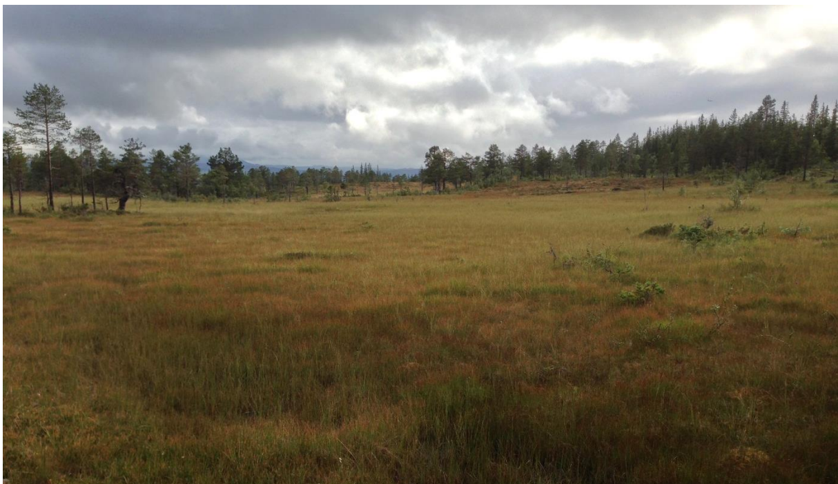
Figur 3. Slåttemyra på Indre Steinmyra, Beitlandet. Sett fra nord.

Verdibegrunnelse: Indre Steinmyra er ei relativt lita slåttemyr som fremdeles er åpen og bærer tydelig preg av langvarig hevd, men den er også påvirka av tråkk fra beitende storfe. Den ligger i et område der slåttemyr er relativt vanlig, men har store partier rik myrvegetasjon og populasjoner av en rødlista art, brunskjene. Dette tilsier verdi B – viktig.