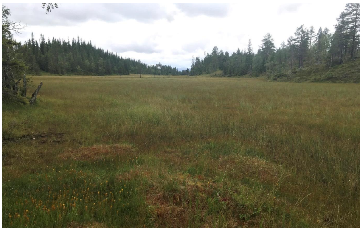
Figur 2. Slåttemyr på Langmyra, Beitlandet.