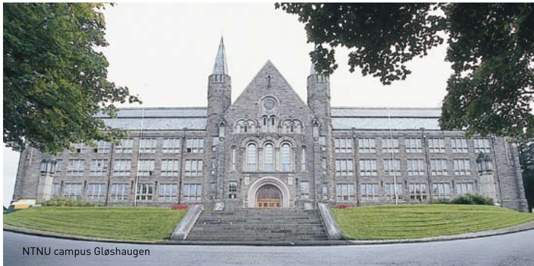
NTNU campus Gløshaugen