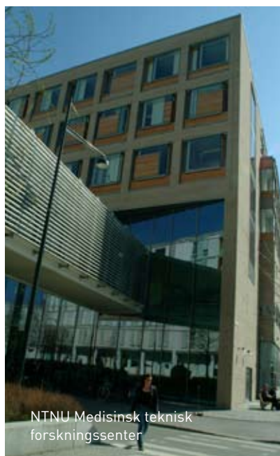
NTNU Medisinsk teknisk forskningssenter