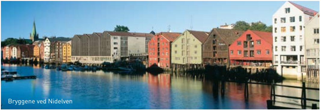
Bryggene ved Nidelven