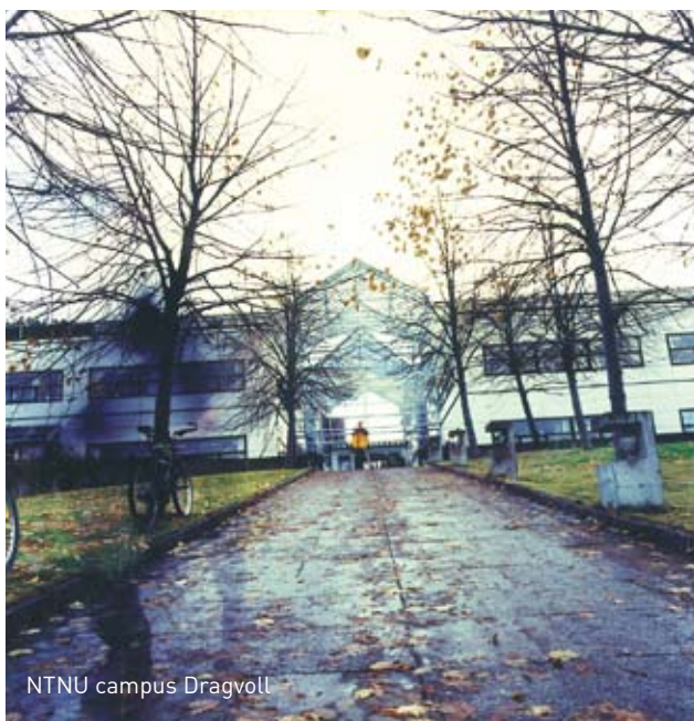
NTNU campus Dragvoll