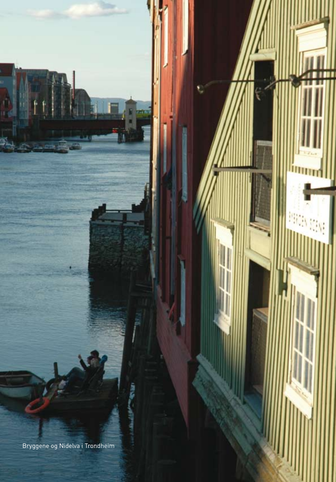
Bryggene og Nidelva i Trondheim