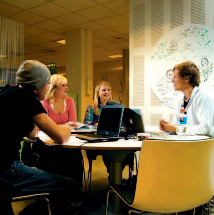
Studentarealet Drivhuset gir gode muligheter for samarbeid studenter i mellom.