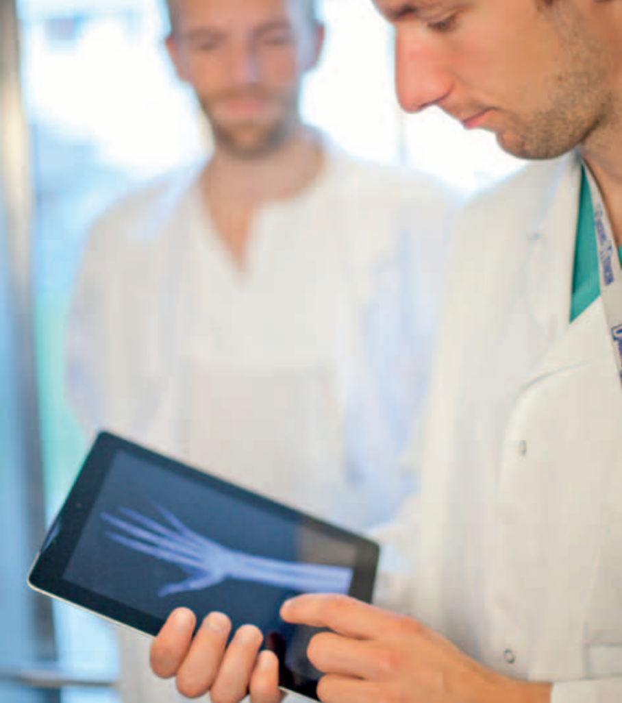
Informasjonsteknologi forenkler hverdagen til leger og sykepleiere.

Eksempler på tverrfaglige kombinasjoner med utgangspunkt i informatikk: